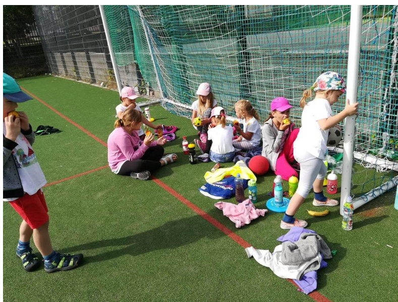
Obrázek11 – Příměstský kroužkový tábor 2018 využíval sportoviště areálu ZŠ Květnového vítězství

Příměstský tábor letos probíhal v 7 turnusech v ZŠ Květnového vítězství a v přilehlém okolí. Byl určen pro děti od 5 do 10 let. Hlavním cílem tábora byl rozvoj kooperativních dovedností.