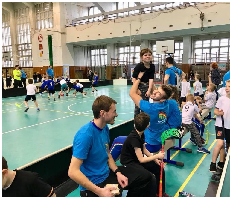
Obrázek6 – Jarní florbalový turnaj - 7. 4. 2018