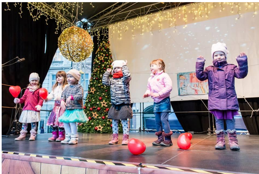
Obrázek 17 - Předvánoční Kroužkovaná podiváná na Staroměstském náměstí, 20. 12. 2017

Podrobný popis akcí, jejich přínos a vyhodnocení je uveden v Příloze číslo 6 této zprávy