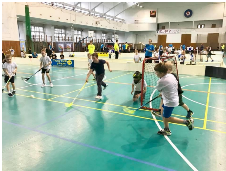
Obrázek12 - Spolupráce s florbalovým klubem při jarním florbalovém turnaji

SVČ Kroužky pro děti Praha spolupracuje s florbalovým klubem a také s profesionální taneční školou. Profesionální trenéři v loňském roce pravidelně navštěvovali