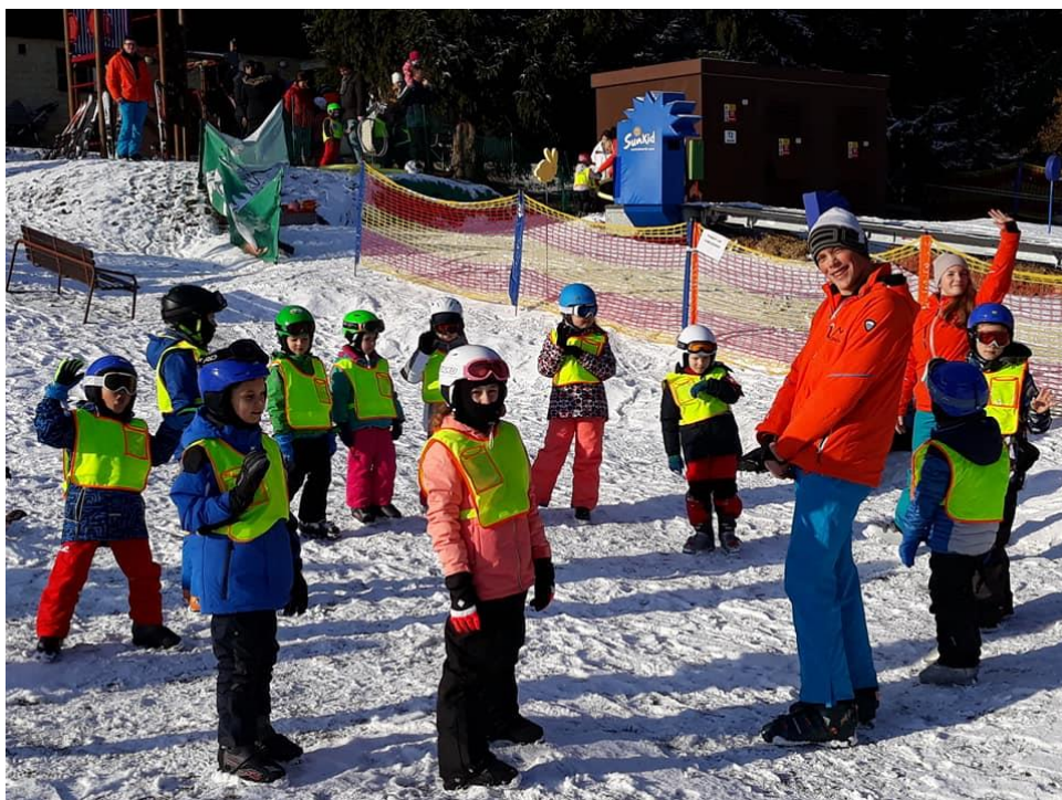
Obrázek9 – Jarní prázdniny, areál Kroužky nad Moníncem