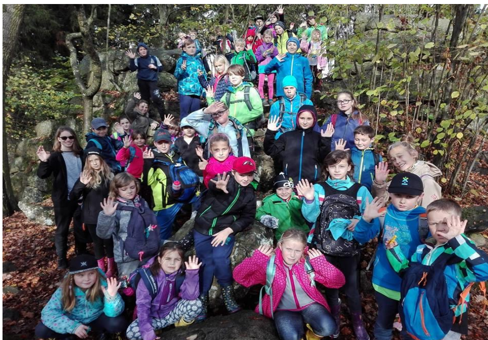
Obrázek7 – Podzimní prázdniny, areál Kroužky nad Moníncem

Námi organizovaný pobyt v těchto dnech, kdy jsou školní prázdniny, ale rodiče jsou zapojeni do pracovního procesu, měl velkou odezvu. Kapacita, kterou pro zimní ubytování areál Kroužky nad Moníncem nabízí, byla velmi rychle naplněna.