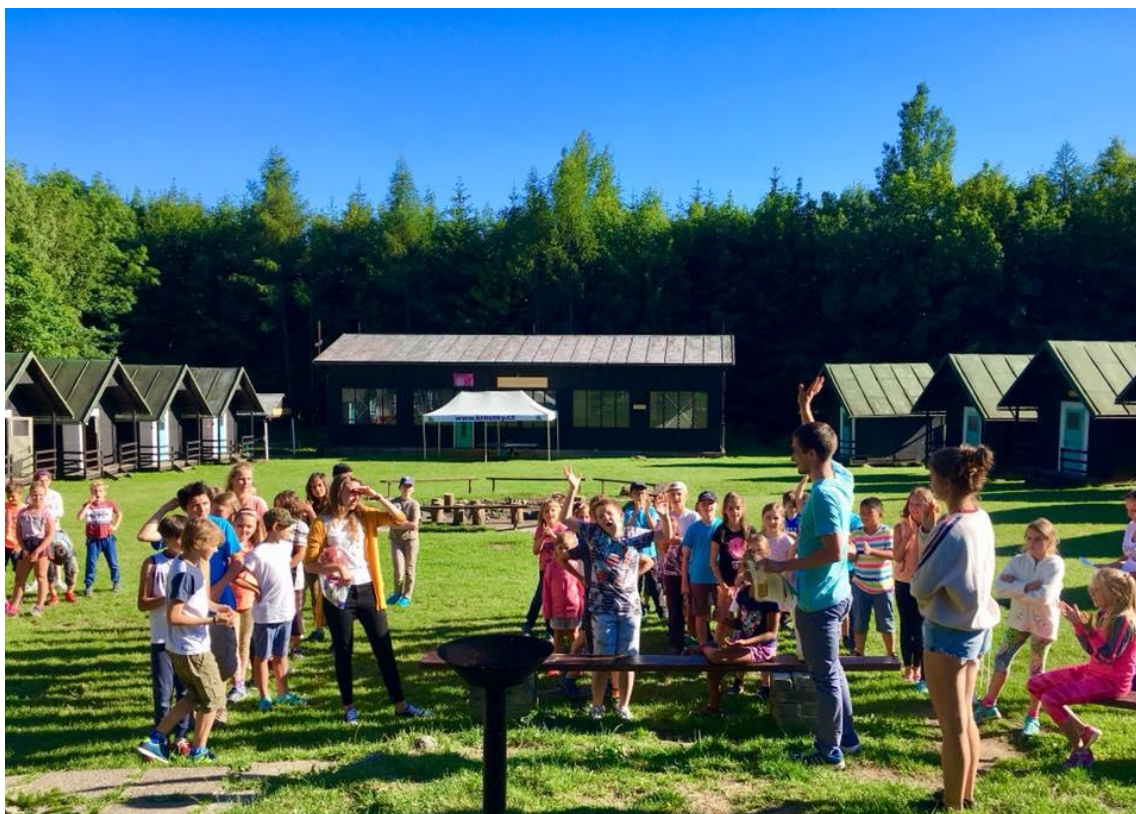
Obrázek10 – Letní tabor opět proběhl v areálu Kroužky nad Moníncem

Kromě celotáborové hry, se děti zdokonalovaly v činnosti, které se obvykle věnují v SVČ Kroužky pro děti během školního roku při pravidelné zájmové činnosti. Během týdenního turnusu si mohly vybrat z těchto útvarů: