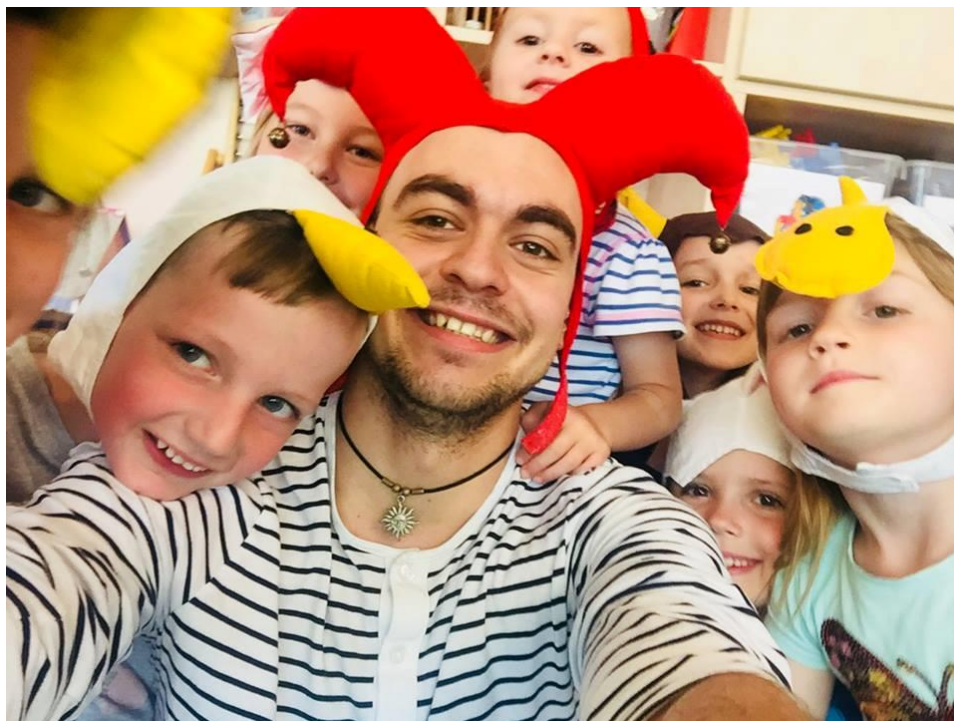
Obrázek4 – Lekce kroužku Divadlo a dramatická výchovana ZŠ

Z výše uvedených důvodů počet účastníků zájmového vzdělávání v průběhu školního roku osciloval. K poslednímu červnu bylo evidováno 6 384 žáků a 32 dětí – účastníků zájmového vzdělávání.