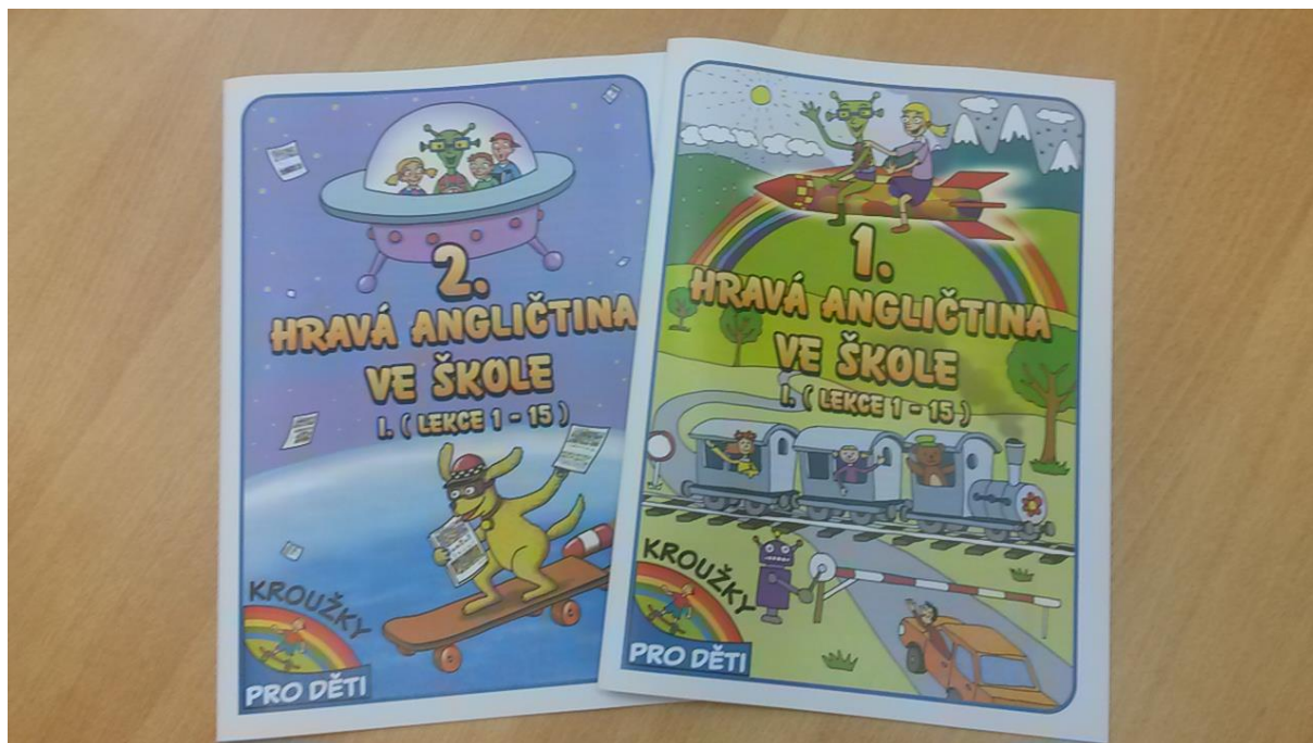
Obrázek14 - Deníky pro kroužek Angličtina