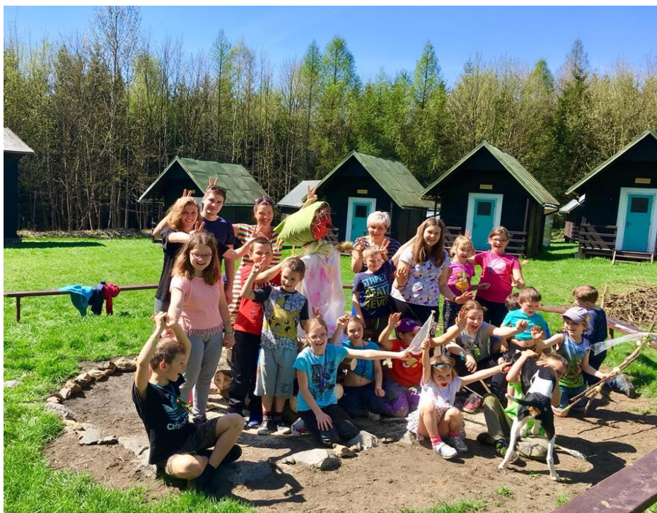
Obrázek8 – Víkendová akce, Čáry, máry, fuk

Vzhledem k pozitivní odezvě ze strany a dětí i rodičů SVČ Kroužky bude v pořádání víkendových akcí pokračovat a plánuje nabídku ještě rozšířit.