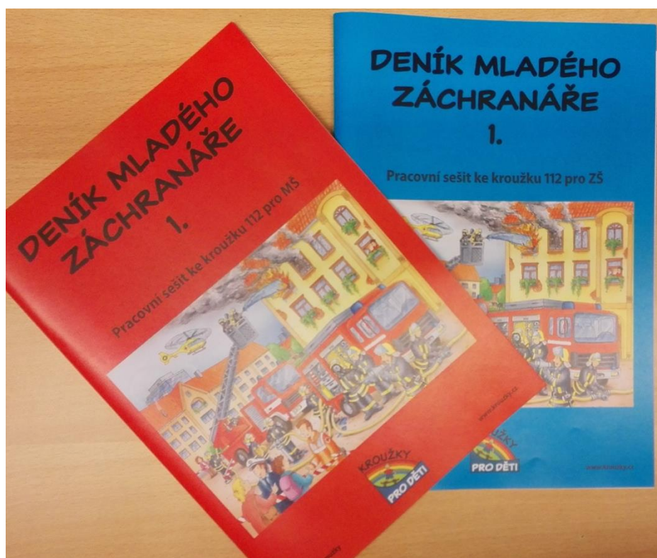
Obrázek 15 - Deník mladého záchranáře na kroužek 112