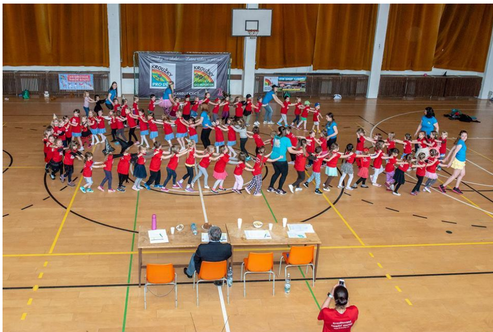
Obrázek1 – Kroužková taneční soutěž - 8. 4. 2018

SVČ Kroužky pro děti je zejména tradičním organizátorem pravidelné zájmové činnosti. Nabídka zájmových útvarů byla ve školním roce 2017/2018 bohatá a pestrá, pedagogičtí pracovníci při nabídce vycházeli ze zájmů dětí, studentů a dospělých, z módního trendu a atraktivnosti.