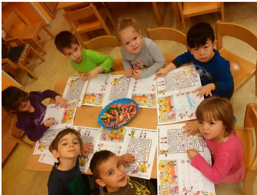
Obrázek 20 - Práce dětí s metodickým sešitem v naší partnerské školce

a výzdoby. Všichni pedagogové společně se svými svěřenci na lekcích pracují i na estetické podobě zmíněných akcí, které mají poté komplexně velmi vysokou úroveň.