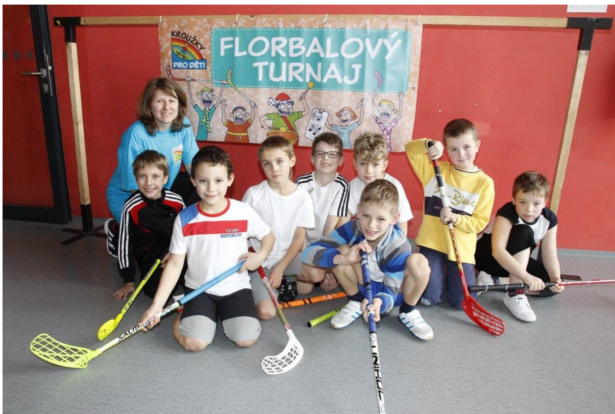
Obrázek 6 - Vánoční florbalový turnaj - 13.12.2015