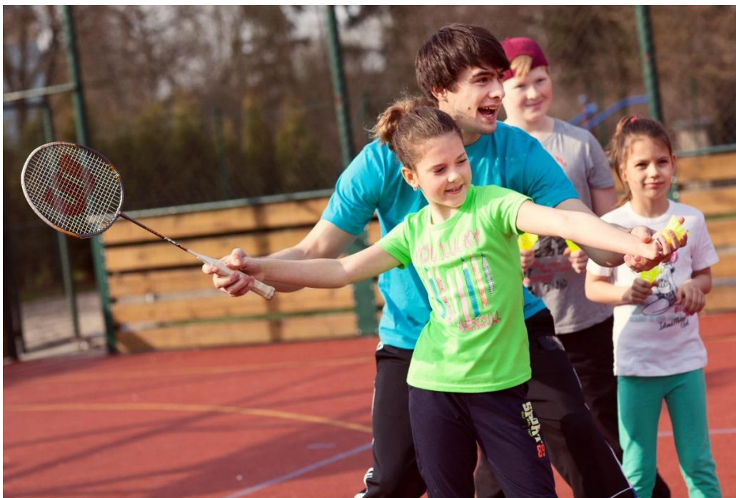
Obrázek 9 - Individuální práce s žákem