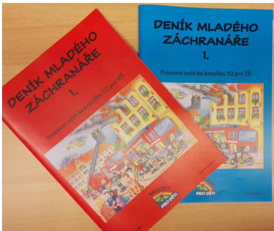
Obrázek 11 - Deník mladého záchranáře na kroužek 112