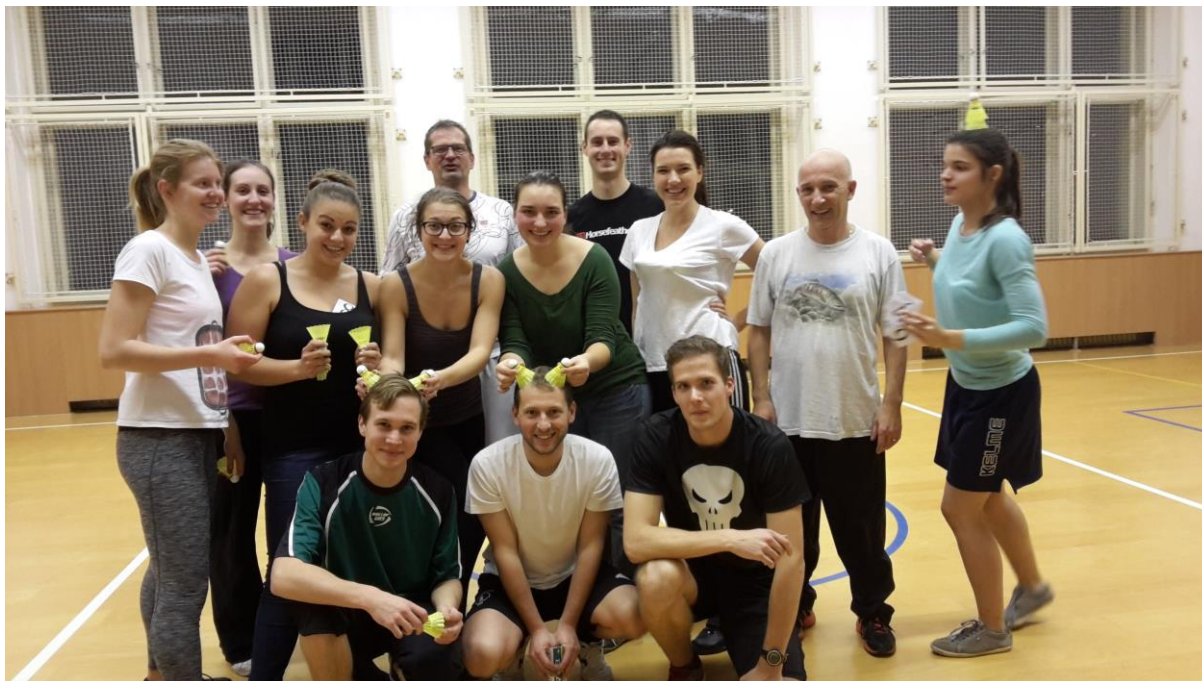
Obrázek 13 - Hry bez hranic - 9.12.2015

Podrobný popis akcí, jejich přínos a vyhodnocení je uveden v Příloze číslo 6 této zprávy