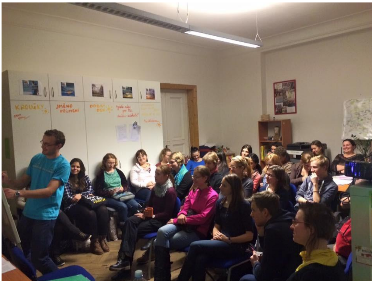
Obrázek 3 - Praktické rady a řešení situace „problémového dítěte“ na lekci - 22.1.2016

V uplynulém školním roce zaměstnanci SVČ Kroužky pro děti absolvovali další vzdělávání nad rámec schváleného plánu DVPP. Nyní mají všichni interní zaměstnanci požadované vzdělání v souladu se zákonem č. 563/2004 Sb., o pedagogických pracovnících, v platném znění a podle ustanovení vyhlášky č. 317/2005 Sb., o dalším vzdělávání pedagogických pracovníků, akreditační komisi a kariérním systému pedagogických pracovníků, v platném znění. Interní zaměstnanci se zúčastnili kurzů či seminářů akreditovaných MŠMT i dalšího vzdělávání, které rozvíjelo jejich klíčové kompetence.