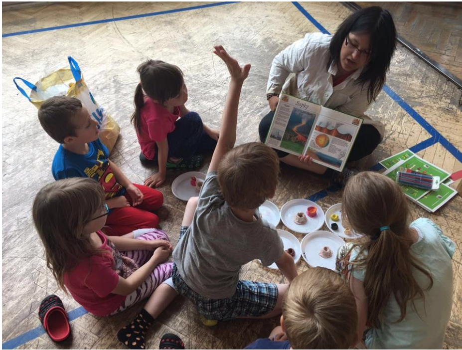
Obrázek 8 - Příměstský tábor