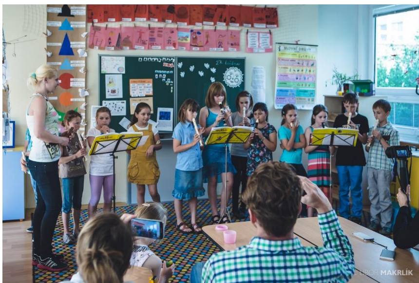
Obrázek 17 - Závěrečná ukázková lekce kroužku Hra na flétnu v ZŠ Angelovova