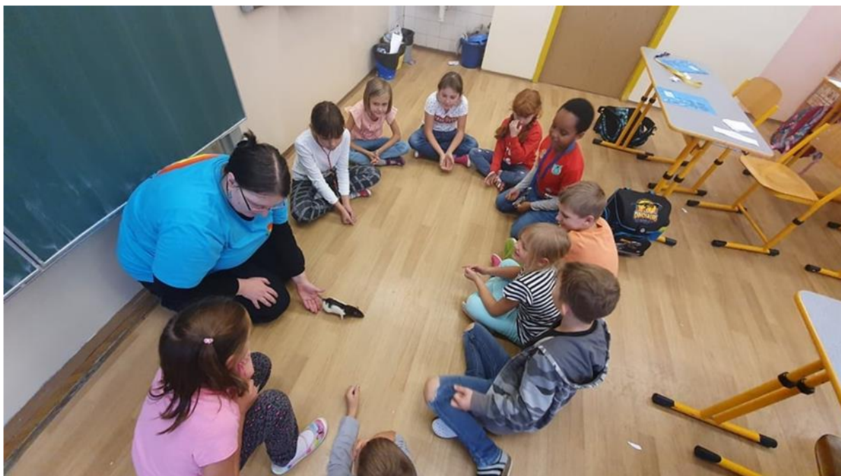
Obrázek 5 – Kroužek o zvířatech se zvířaty

Náplň jednotlivých zájmových útvarů je dána Plány zájmových útvarů. Jejich dodržování v průběhu školního roku kontrolují metodici. Účastníci zájmového vzdělávání jsou hodnoceni v průběhu vzdělávacího procesu. V letošním školním roce jsme vzhledem k tomu, že se kvůli hygienickým opatřením nerozdávalo vysvědčení o absolvování zájmového útvaru nerozdávaly vysvědčení jako v předchozích letech.