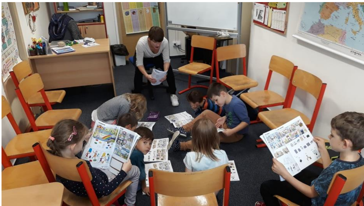
Obrázek 19 - Práce dětí s metodickým sešitem v naší partnerské škole