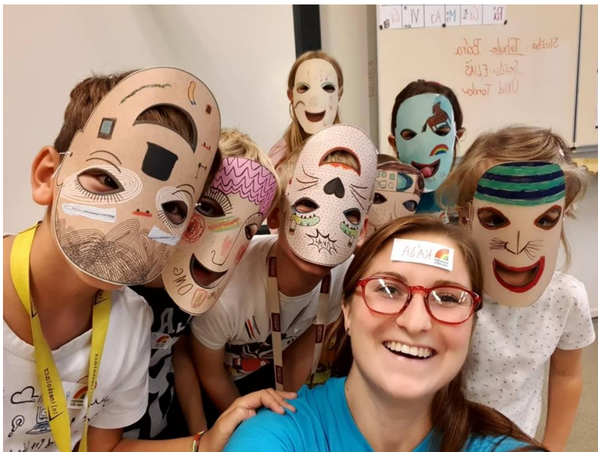
Obrázek 4 - Lekce kroužku výtvarné výchovy

Žáci a děti se účastnily zájmového vzdělávání v zájmových útvarech, které dle náplně dělíme na