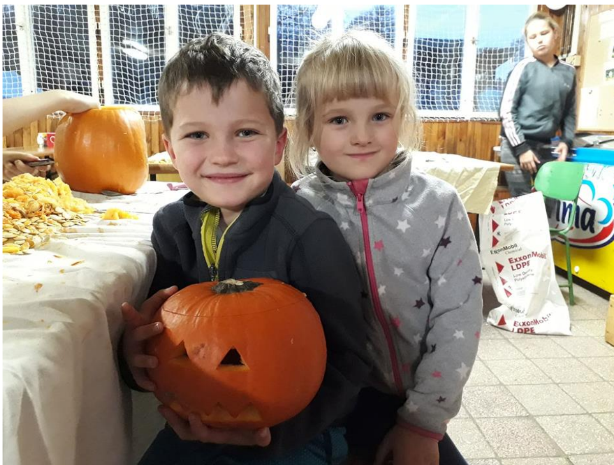
Obrázek 8 - Podzimní prázdniny, areál Kroužky nad Moníncem

V době jarních prázdnin jsme ve spolupráci s partnerskými organizacemi opět uspořádali lyžařský tábor. Byl určen i pro nelyžaře ale v pořádaných turnusech všichni účastníci absolvovali i lyžařský výcvik.