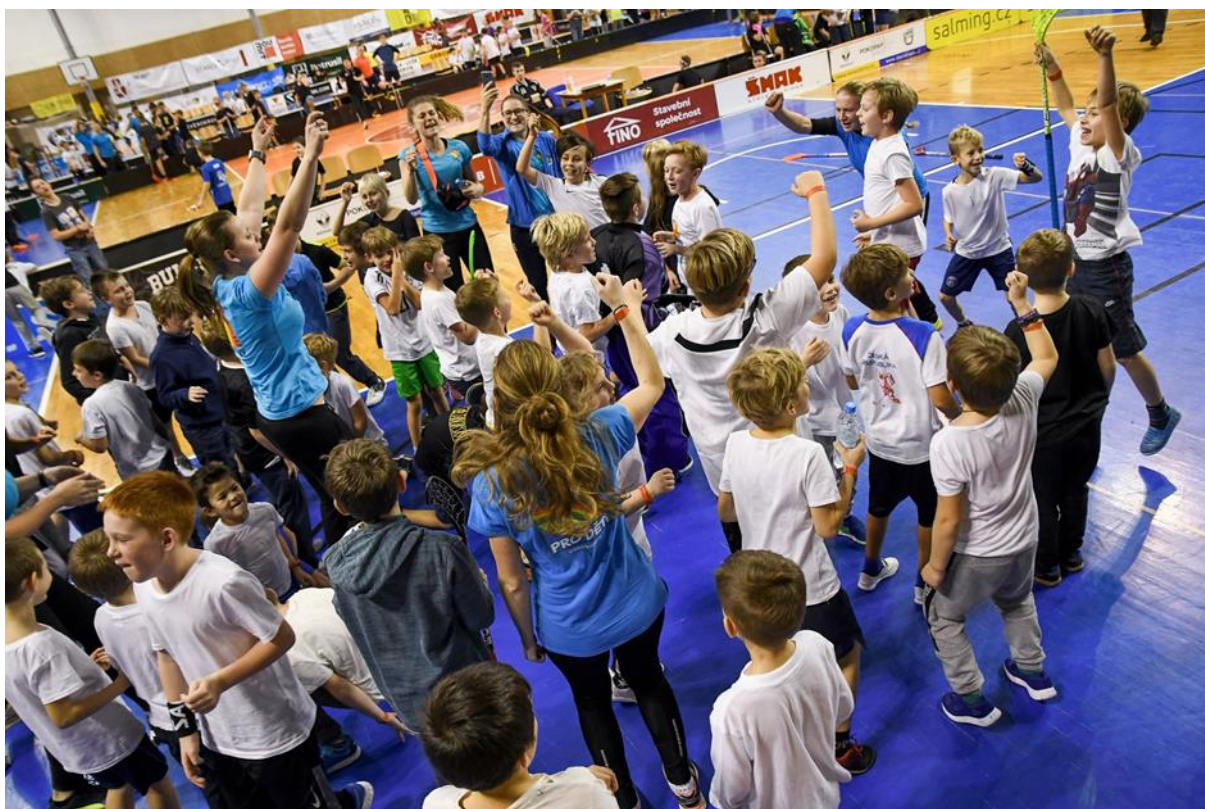
Obrázek 6 – Československý florbalový turnaj