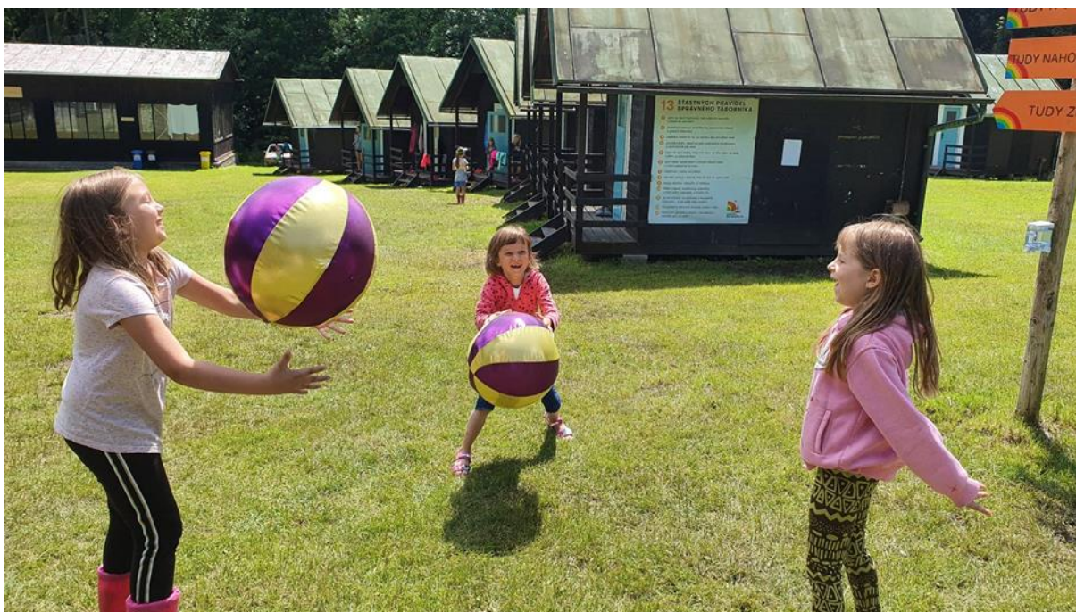
Obrázek 10 - Letní tábor opět proběhl v areálu Kroužky nad Moníncem

Kromě celotáborové hry se děti zdokonalovaly v činnosti, které se obvykle věnují v SVČ Kroužky pro děti během školního roku při pravidelné zájmové činnosti. Během týdenního turnusu si mohly vybrat z těchto útvarů: