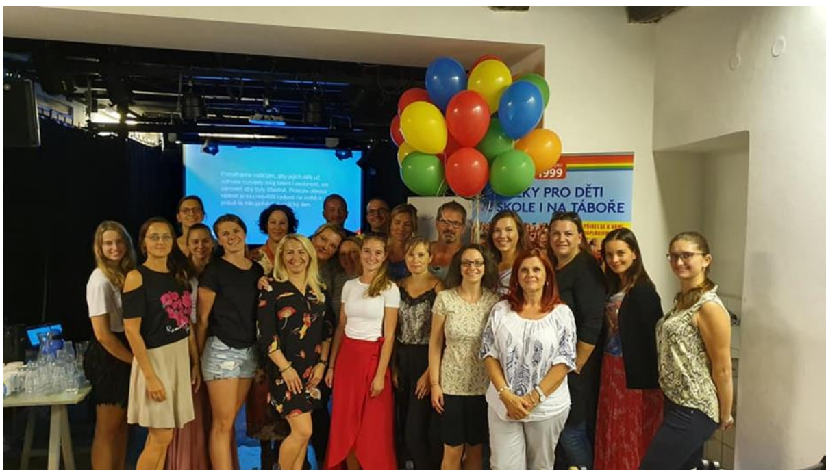
Obrázek 2- Interní zaměstnanci

Ve vedení SVČ Kroužky pro děti pracovalo v uplynulém 16 externích pedagogických pracovníků pracovalo na Dohodu o provedení práce, v podstatě však v režimu interních pracovníků. Pravidelná činnost byla soustředěna do 47 zájmových útvarů, kde mimo interní pracovníky pracovalo na Dohodu o provedení práce 68 externích pracovníků. Počet útvarů i externích zaměstnanců v průběhu školního roku kolísal dle zájmu účastníků zájmového vzdělávání.