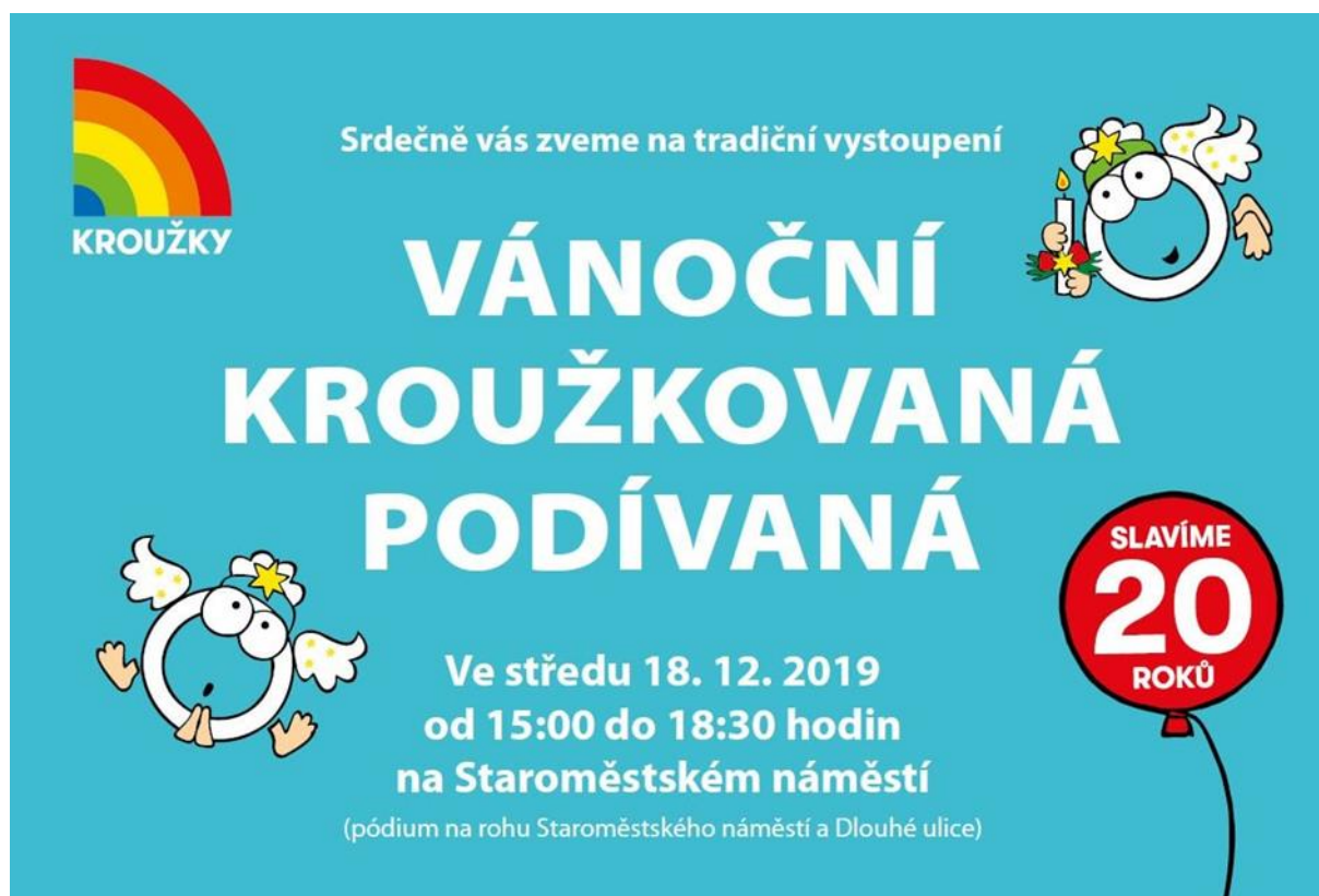
Obrázek18 – pozvánka na Kroužkovou podívanou