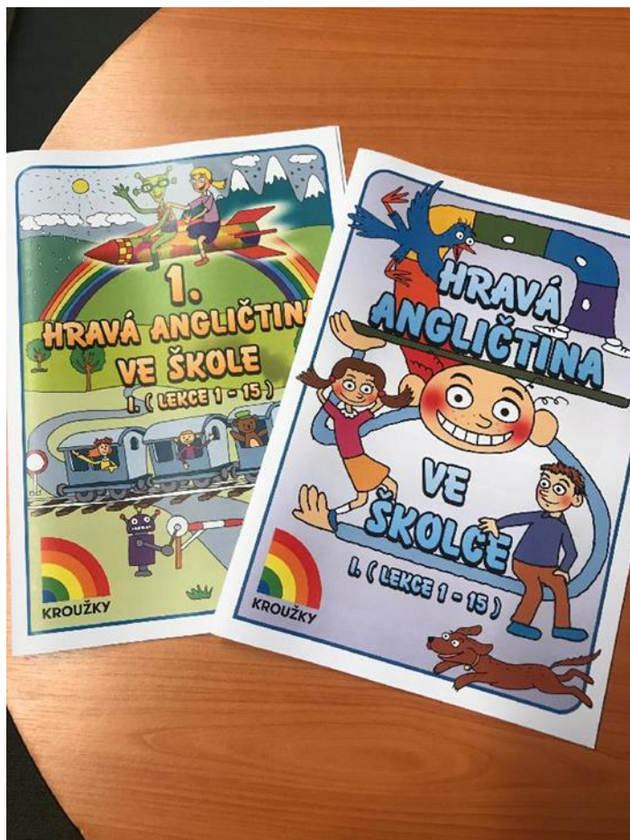
Obrázek 12 – Metodika pro kroužek Angličtina

vzdělávání probíhalo v jednotlivých zájmových útvarech podle jednotných pravidel a bylo tím umožněno hodnocení samotného vzdělávacího procesu. Výsledek metodické práce jsou metodiky pro vedení kroužků a u edukativních kroužků deníky pro žáky. Tyto materiály využívají také partnerské SVČ a neziskové organizace.