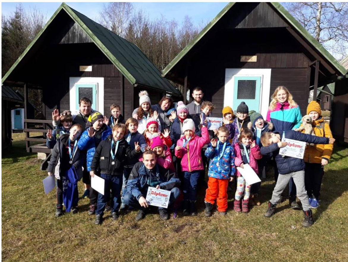
Obrázek 9 - Jarní prázdniny, areál Kroužky nad Moníncem

Jarní tábor s lyžováním proběhl v areálu Kroužky nad Moníncem. Zde probíhala celotáborová hra a další aktivity. Samotný lyžařský výcvik byl realizován ve Ski areálu Monínece a jako lyžařští instruktoři v něm působili odborníci z Lyžařské školy zmíněného areálu.