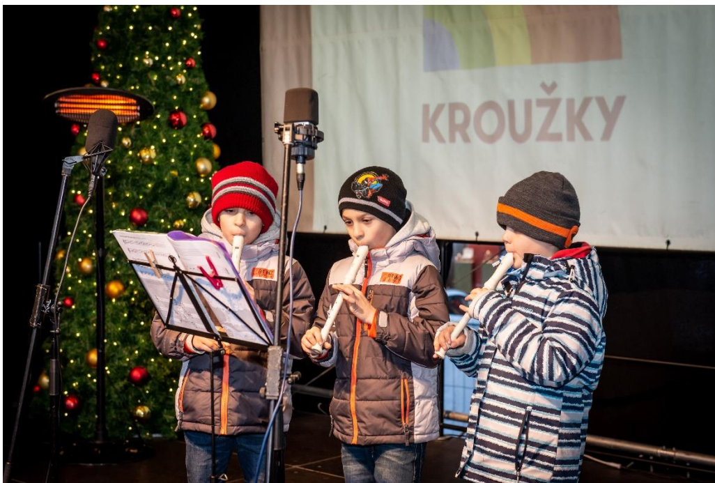
Obrázek 16 - Předvánoční Kroužkována podivaná na Staroměstském náměstí, 20. 12. 2017