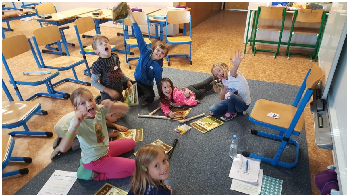
Obrázek21- Děti na kroužku flétny

Úkol splněn. Dotazníky a jejich vyhodnocení jsou součástí autoevaluace školského zařízení. V roce 2019/2020 vzhledem k omezení výuky nebyly použity, jejich vypovídající hodnota by nebyla validní