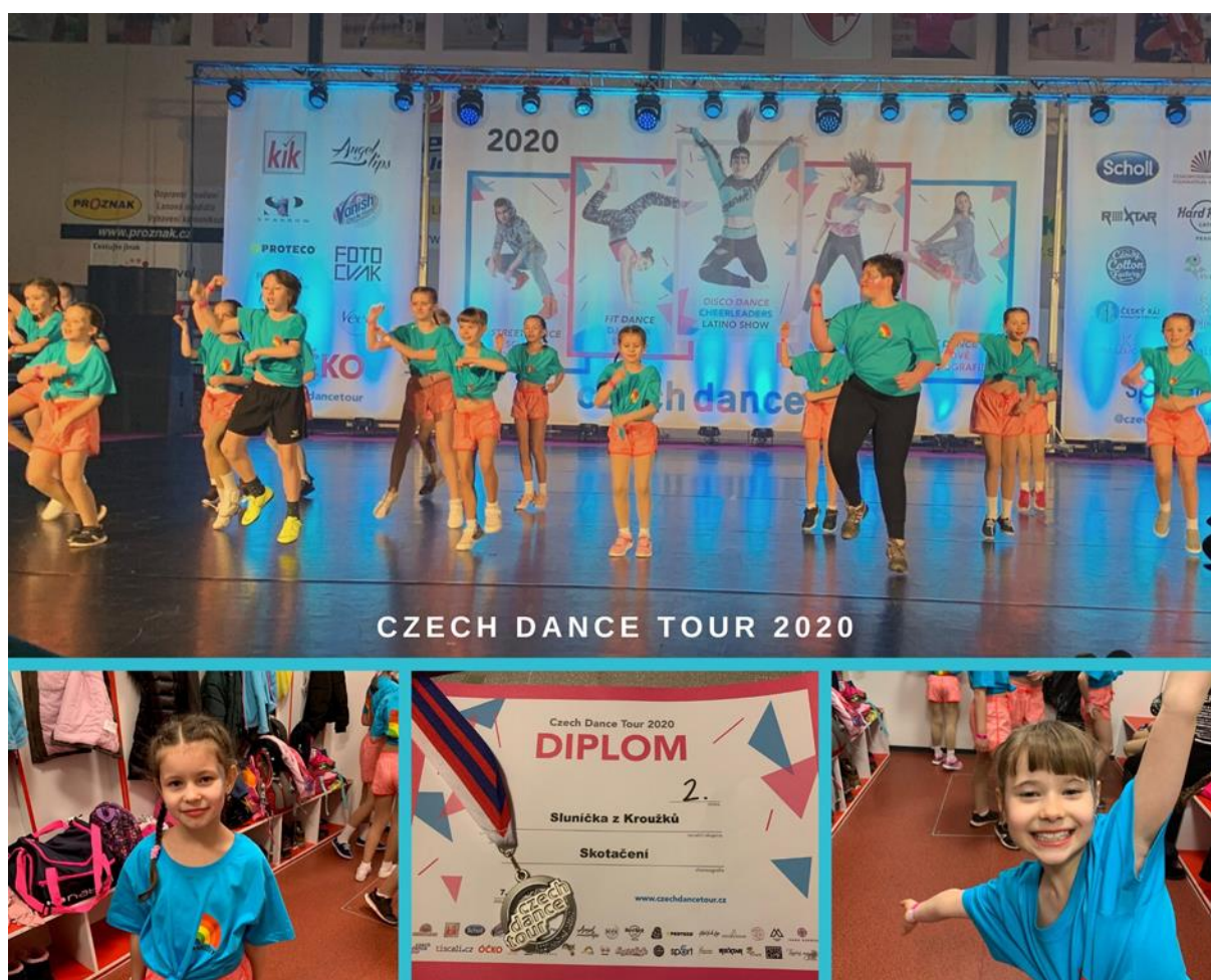
Obrázek 22 - Taneční soutěž

Úkol plněn každoročně na pedagogické poradě.