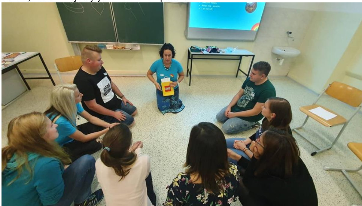
Obrázek 3 - Školení pro další vzdělávání pedagogických pracovníků - DVPP

V uplynulém školním roce zaměstnanci SVČ Kroužky pro děti absolvovali další vzdělávání nad rámec schváleného plánu DVPP. Nyní mají všichni pseudointerní zaměstnanci požadované vzdělání v souladu se zákonem č. 563/2004 Sb., o pedagogických pracovnících, v platném znění a podle ustanovení vyhlášky č. 317/2005 Sb., o dalším vzdělávání pedagogických pracovníků, akreditační komisi a kariérním systému pedagogických pracovníků, v platném znění. Pseudointerní zaměstnanci se zúčastnili kurzů či seminářů akreditovaných MŠMT i dalšího vzdělávání, které rozvíjelo jejich klíčové kompetence.