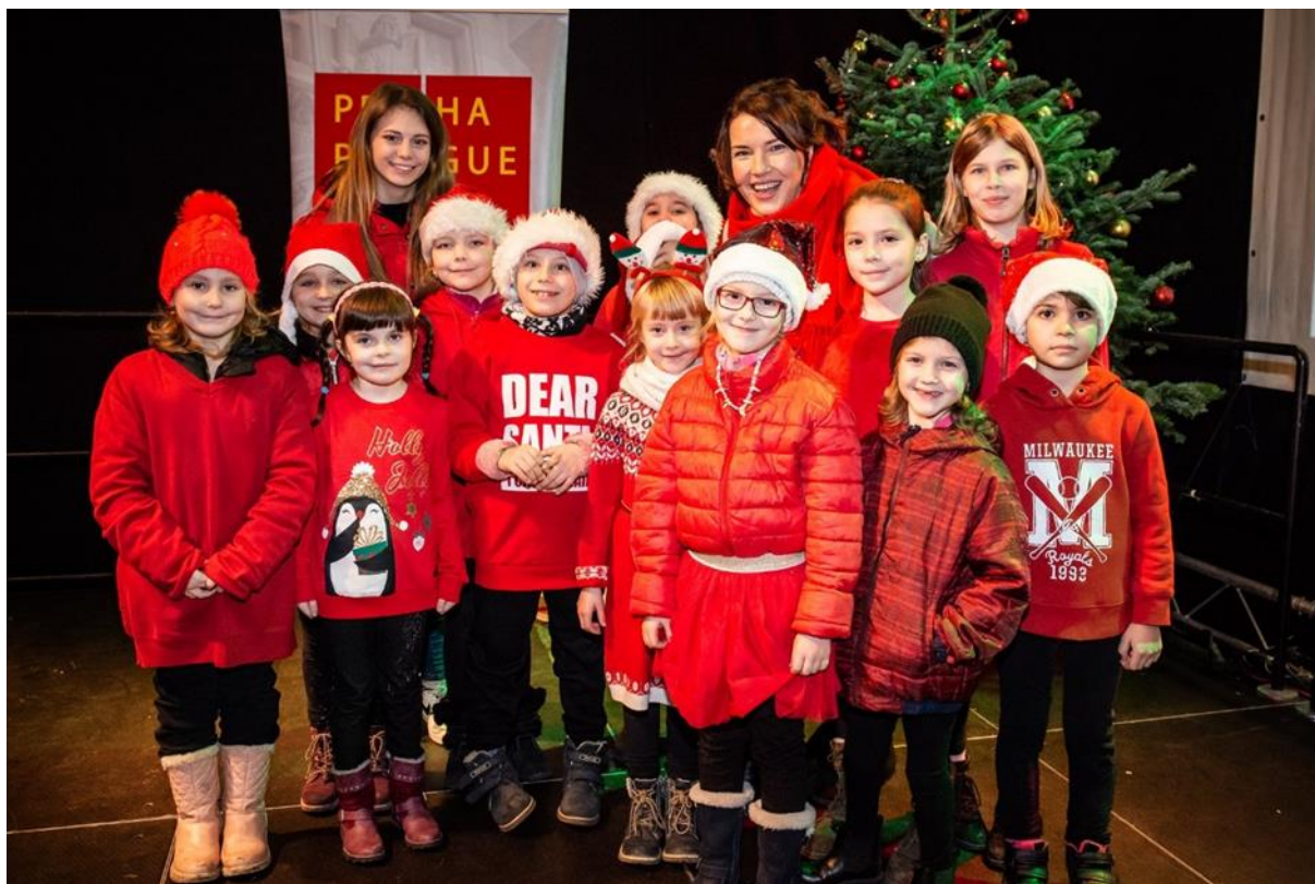
Obrázek 1 – Kroužkovaná podívaná

SVČ Kroužky pro děti je zejména tradičním organizátorem pravidelné zájmové činnosti. Nabídka zájmových útvarů byla ve školním roce 2019/2020 bohatá a pestrá, pedagogičtí pracovníci při nabídce vycházeli ze zájmů dětí, studentů a dospělých, z módního trendu a atraktivnosti.