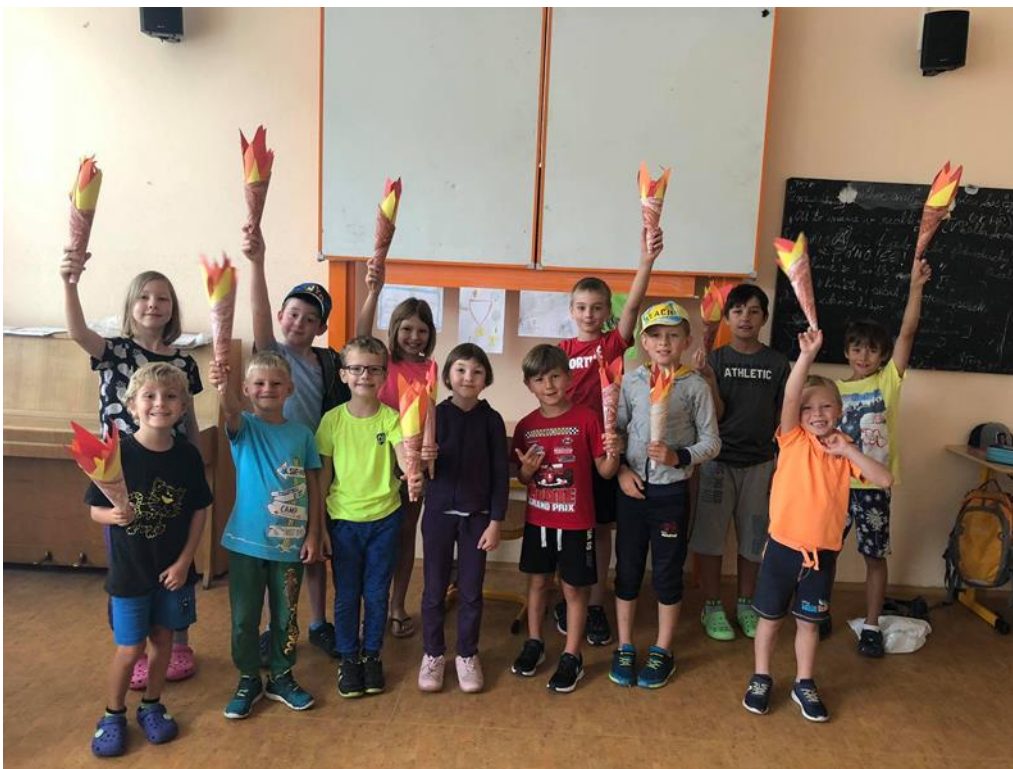
Obrázek 11- Příměstský tábor