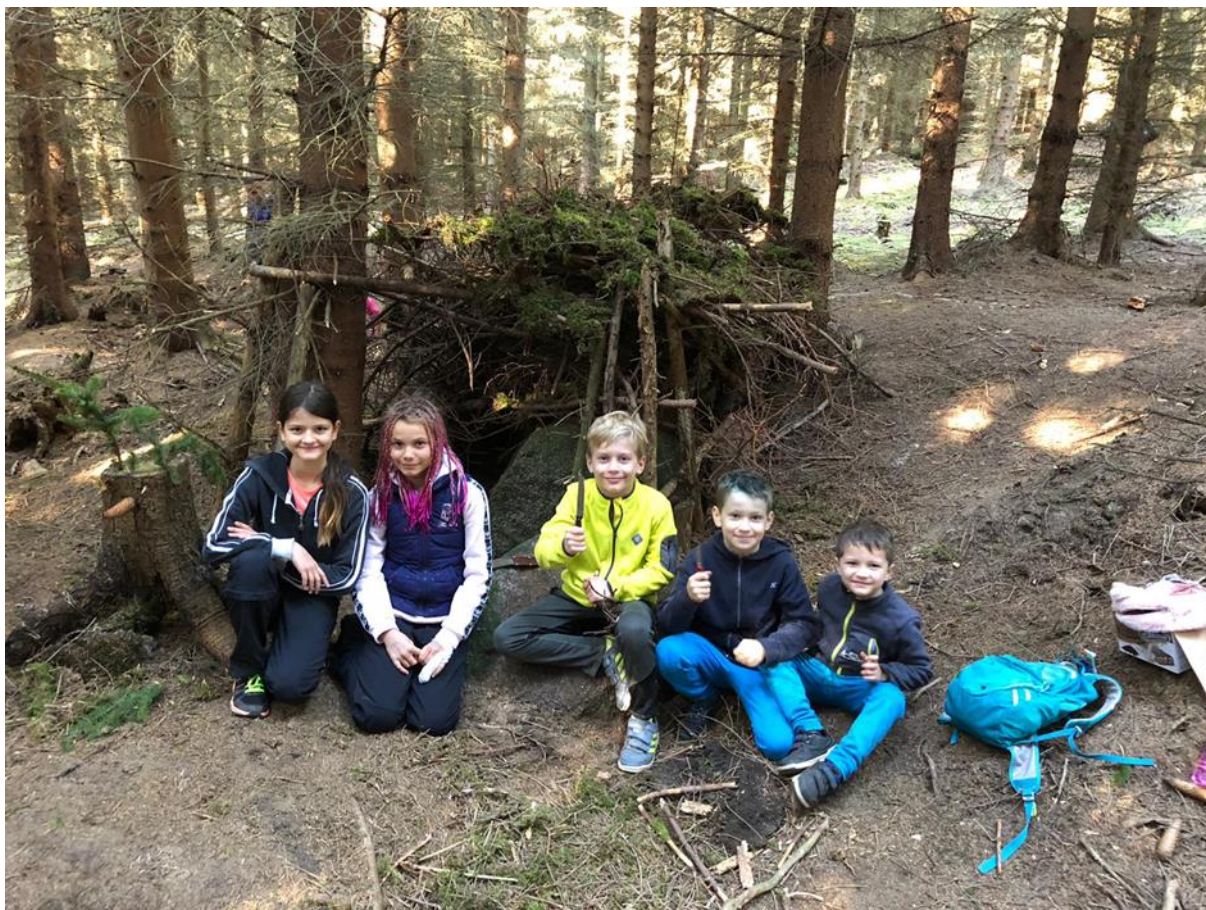
Obrázek 7 - Podzimní prázdniny, areál Kroužky nad Moníncem

Organizovaný pobyt v těchto dnech, kdy jsou školní prázdniny, ale rodiče jsou zapojeni do pracovního procesu měl velkou odezvu. Kapacita, kterou pro zimní ubytování areál Kroužky nad Moníncem nabízí, byla velmi rychle naplněna.