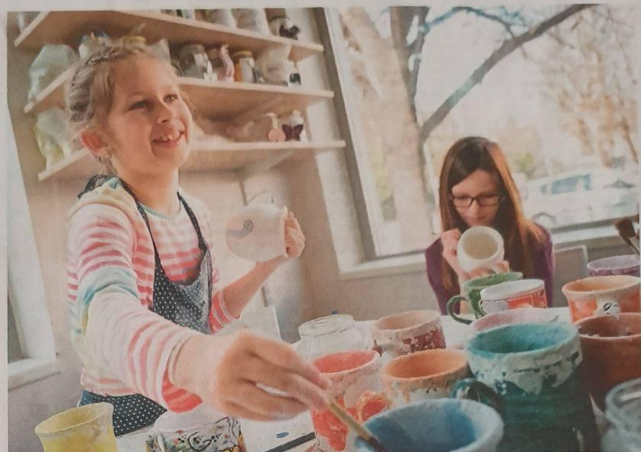
Dvě mouchy jednou ranou. Kroužky keramiky rozvíjí zručnost i výtvarné citění zároveň. Baví kluky i děvčata.