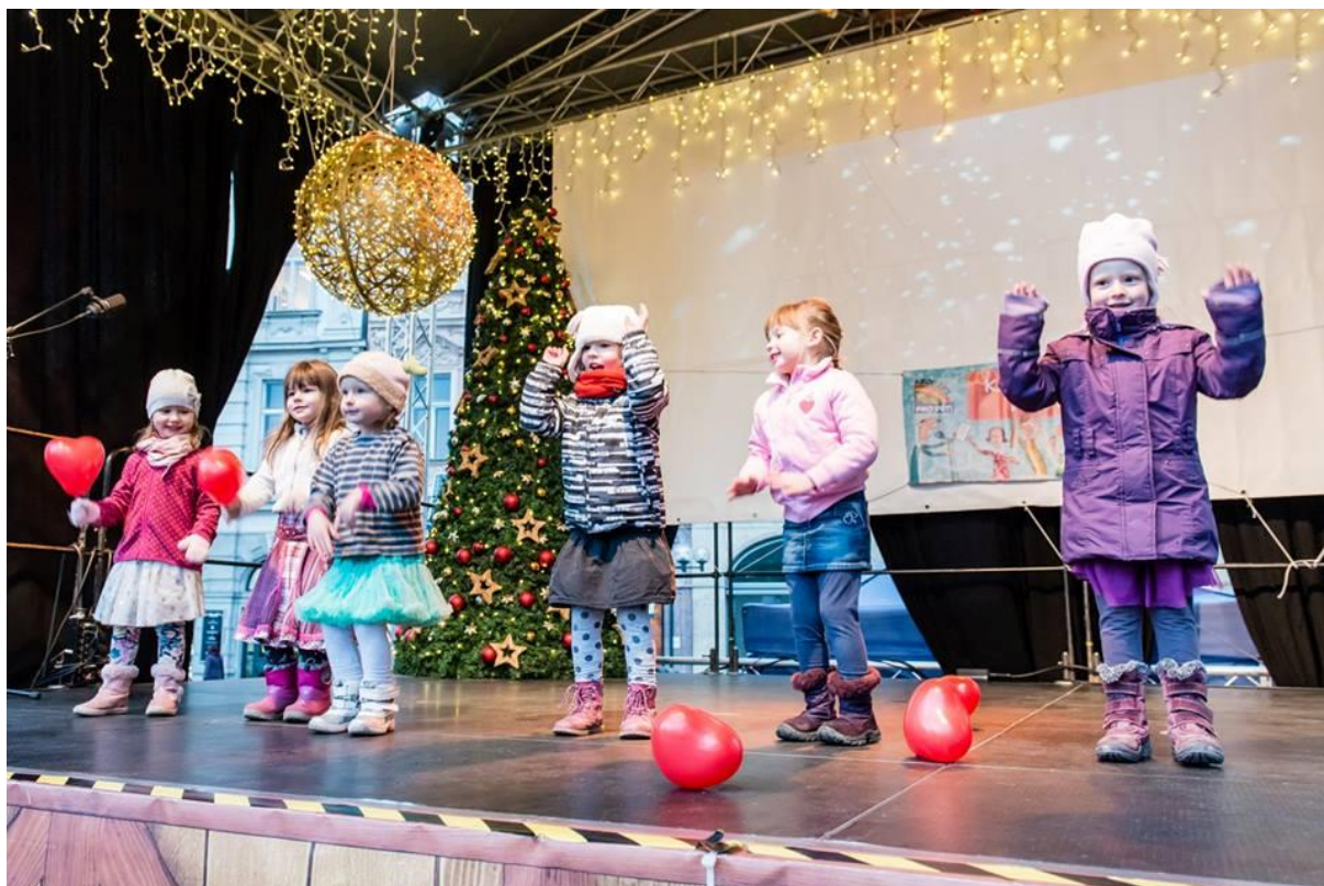
Obrázek 18 - Předvánoční Kroužkována podivána na Staroměstském náměstí, 20. 12. 2017