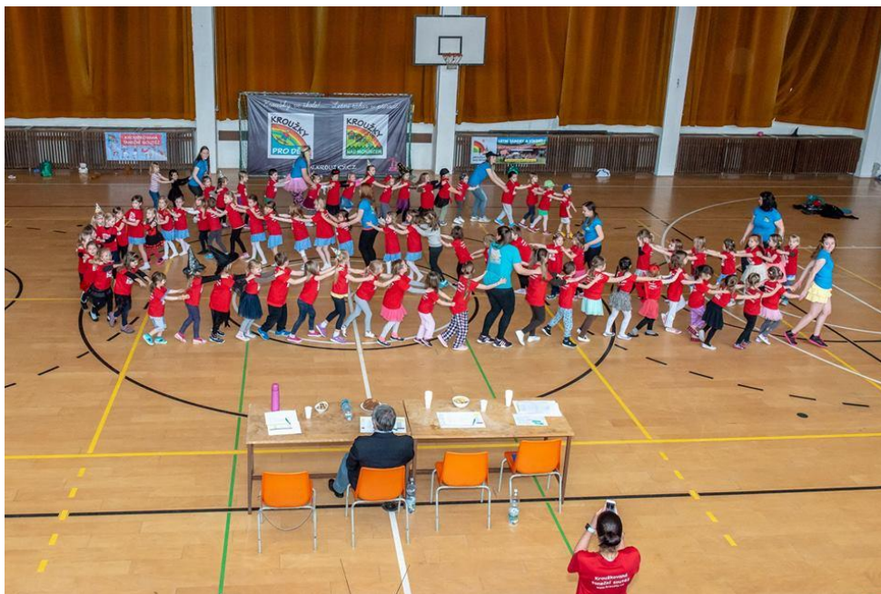
Obrázek 1 – Kroužková taneční soutěž - 8. 4. 2018

SVČ Kroužky pro děti je zejména tradičním organizátorem pravidelné zájmové činnosti. Nabídka zájmových útvarů byla ve školním roce 2017/2018 bohatá a pestrá, pedagogičtí pracovníci při nabídce vycházeli ze zájmů dětí, studentů a dospělých, z módního trendu a atraktivnosti.