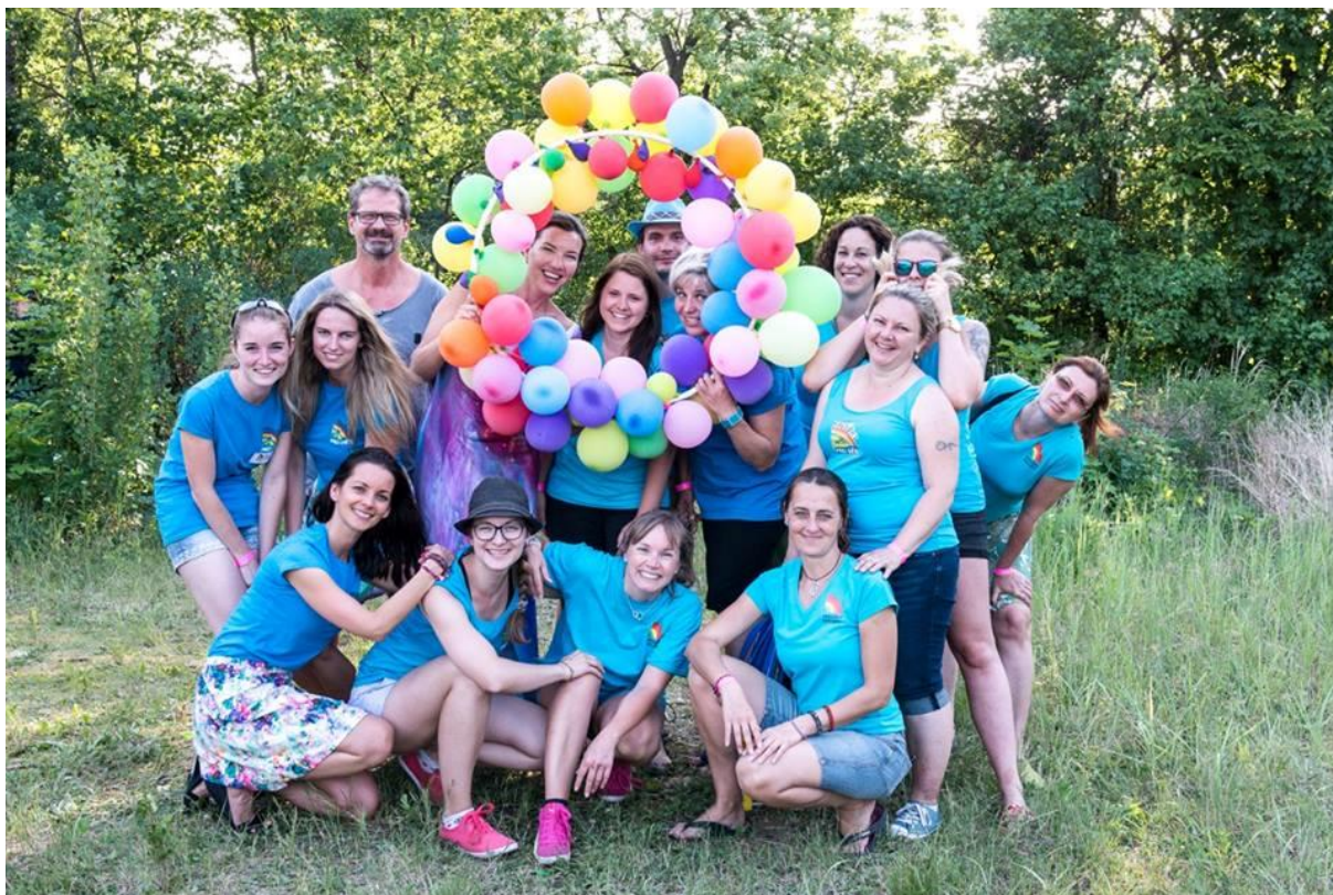
Obrázek 2- Interní zaměstnanci

V SVČ Kroužky pro děti pracovalo v uplynulém školním roce na plný úvazek 0,5 interních pedagogických pracovníků, dalších 9 externích pedagogických pracovníků pracovalo sice na Dohodu o provedení práce, v podstatě však v režimu interních pracovníků. Pravidelná činnost byla soustředěna do 75 zájmových útvarů, kde mimo interní pracovníky pracovalo na Dohodu o provedení práce 97 externích pracovníků. Počet útvarů i externích zaměstnanců v průběhu školního roku kolísal dle zájmu účastníků zájmového vzdělávání.