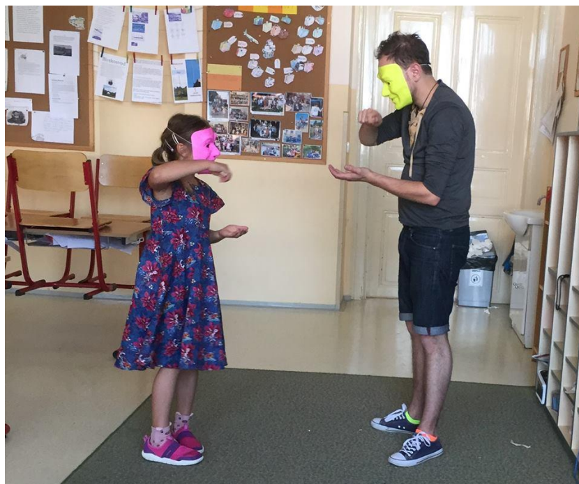
Obrázek 13 – Individuální práce s žákem

Podrobné výsledky jsou uvedeny v Příloze číslo 8 této zprávy.