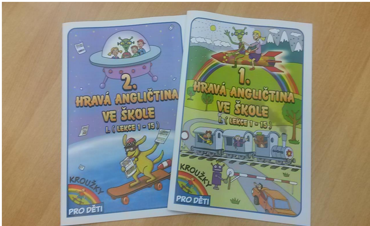
Obrázek 14 - Metodika pro kroužek Angličtina

Vedoucí zájmových útvarů SVČ kroužky pro děti se v uplynulém školním roce věnovali především rozpracování metodických manuálů pro žáky a jejich lektory. Vzhledem k tomu, že SVČ Kroužky pro děti spolupracuje s velkým počtem lektorů, je třeba, aby zájmové vzdělávání probíhalo v jednotlivých zájmových útvarech podle jednotných pravidel a bylo tím umožněno hodnocení samotného vzdělávacího procesu. Výsledkem metodické práce jsou metodiky pro vedení kroužků a u edukativních kroužků deníky pro žáky. Tyto materiály využívají také partnerské SVČ a neziskové organizace.