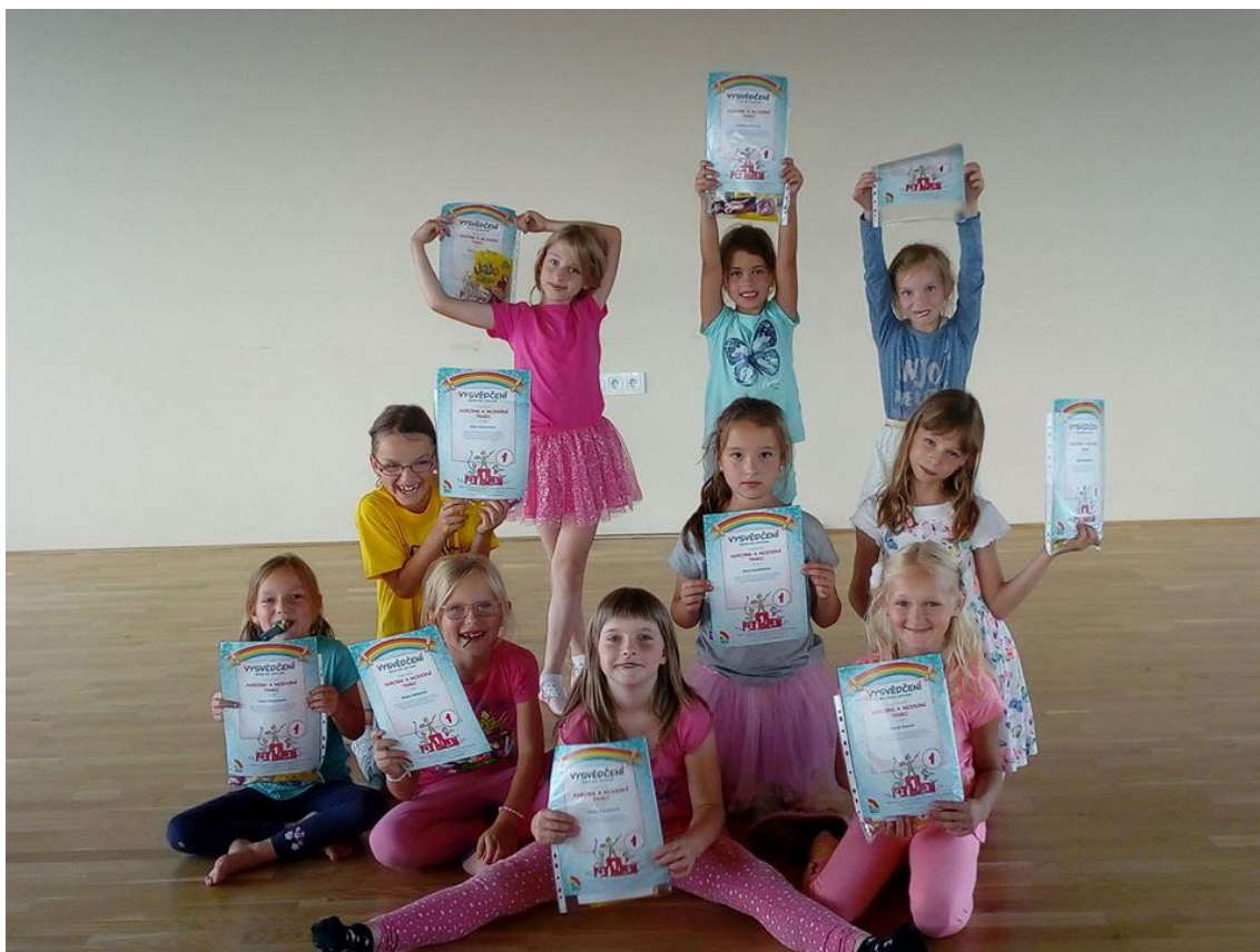
Obrázek 5 - Vysvědčení

V uplynulém školním roce byly Plány jednotlivých útvarů ve všech z nich dodrženy a u účastníků zájmového vzdělávání byl v průběhu školního roku zaznamenán viditelný progres. Lektoři kroužků prováděli v průběhu vzdělávání hodnocení jednotlivých účastníků zájmového vzdělávání, které bylo pozitivní a motivující – aby v činnosti pokračovali i dalším školním roce.