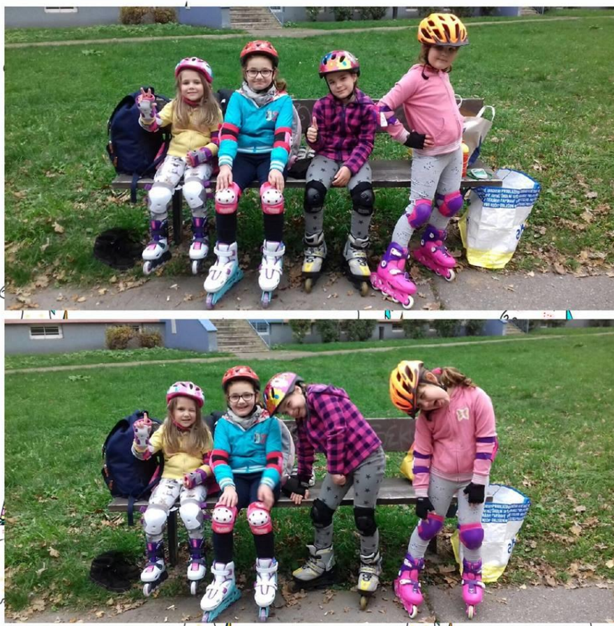
Obrázek 4 - Lekce kroužku In-line na Základní škole

Žáci a děti se účastnily zájmového vzdělávání v zájmových útvarech, které dle náplně dělíme na