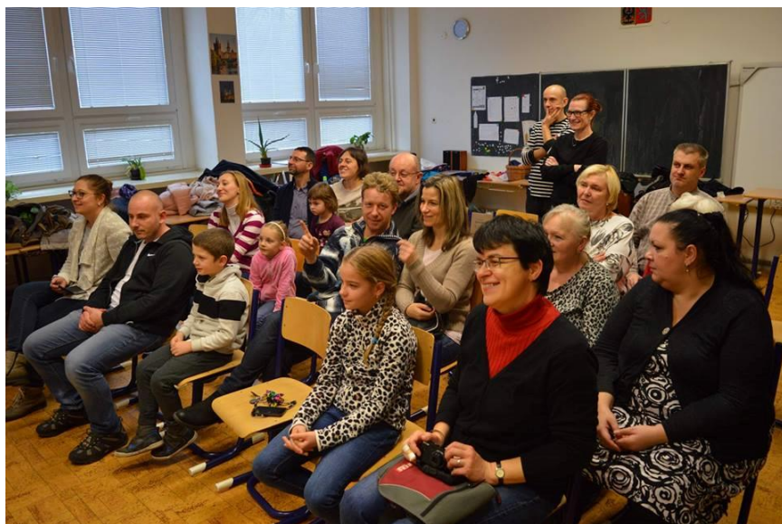
Obrázek 23 - Závěrečná ukázková lekce kroužku Divadlo a dramatická tvorba