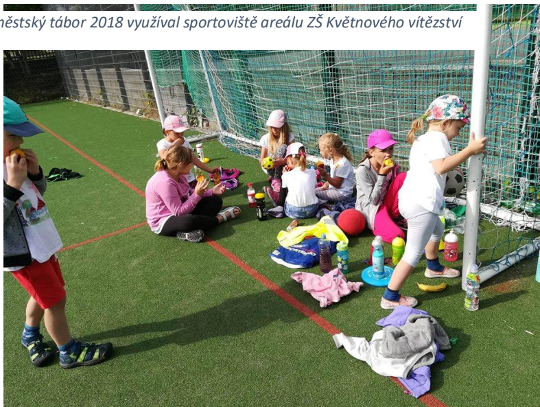
Obrázek 11 - Příměstský tábor 2018 využíval sportoviště areálu ZŠ Květnového vítězství

Podrobný popis táborů, jejich přínos a vyhodnocení je uveden v Příloze číslo 7 této zprávy.