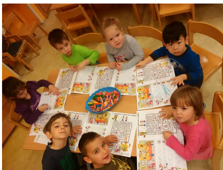
Obrázek 16 - Práce dětí s naší metodikou