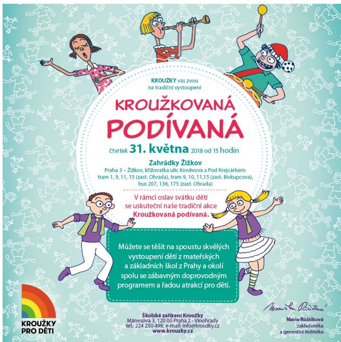
Obrázek 20 - Propagace květnové Kroužkové podívaná