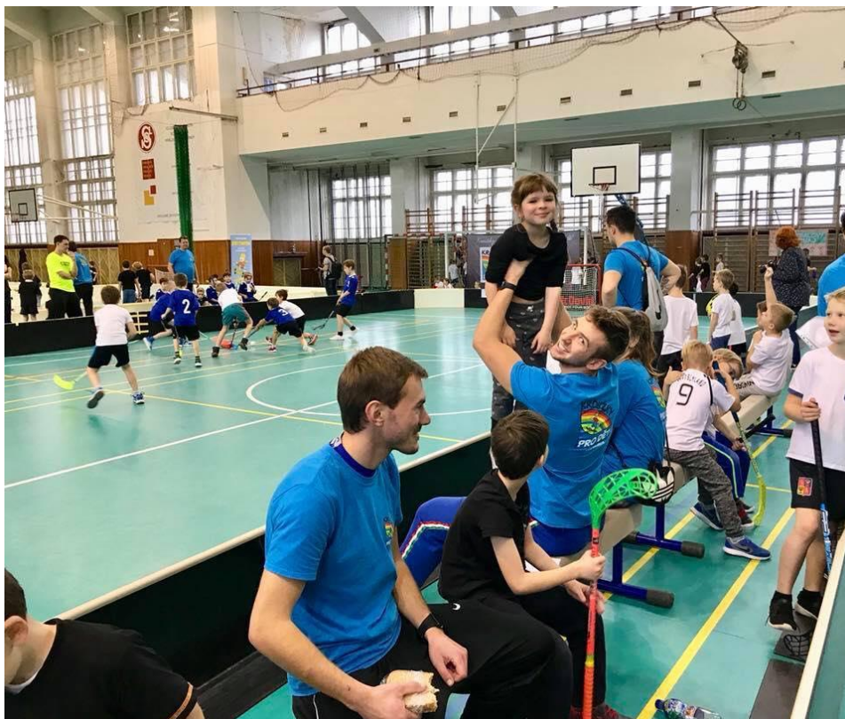
Obrázek 6 - Jarní florbalový turnaj - 7. 4. 2018

Podrobný popis akcí, jejich přínos a vyhodnocení je uveden v Příloze číslo 6 této zprávy.