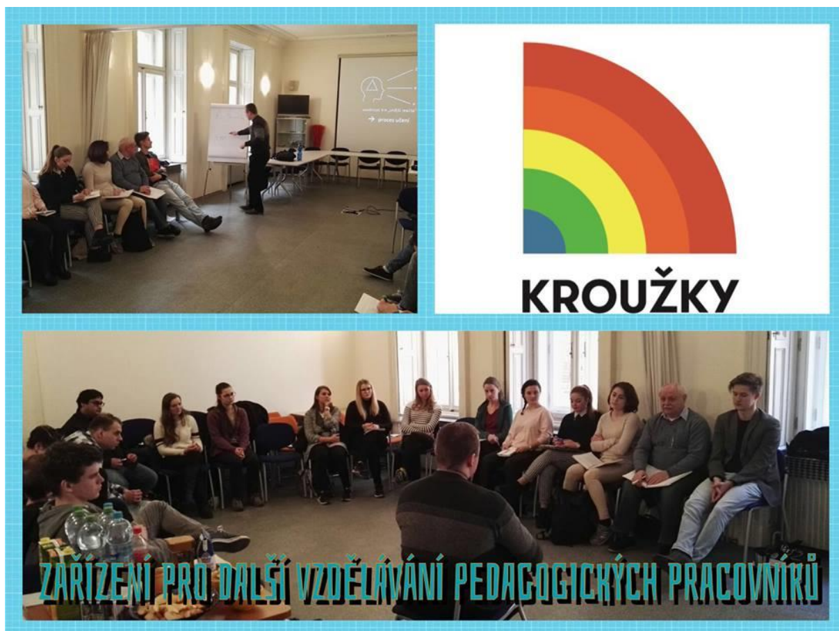
Obrázek 3 - Školení pro další vzdělávání pedagogických pracovníků - DVPP

Konkrétní účast na jednotlivých programech je Přílohou číslo 1 této zprávy.