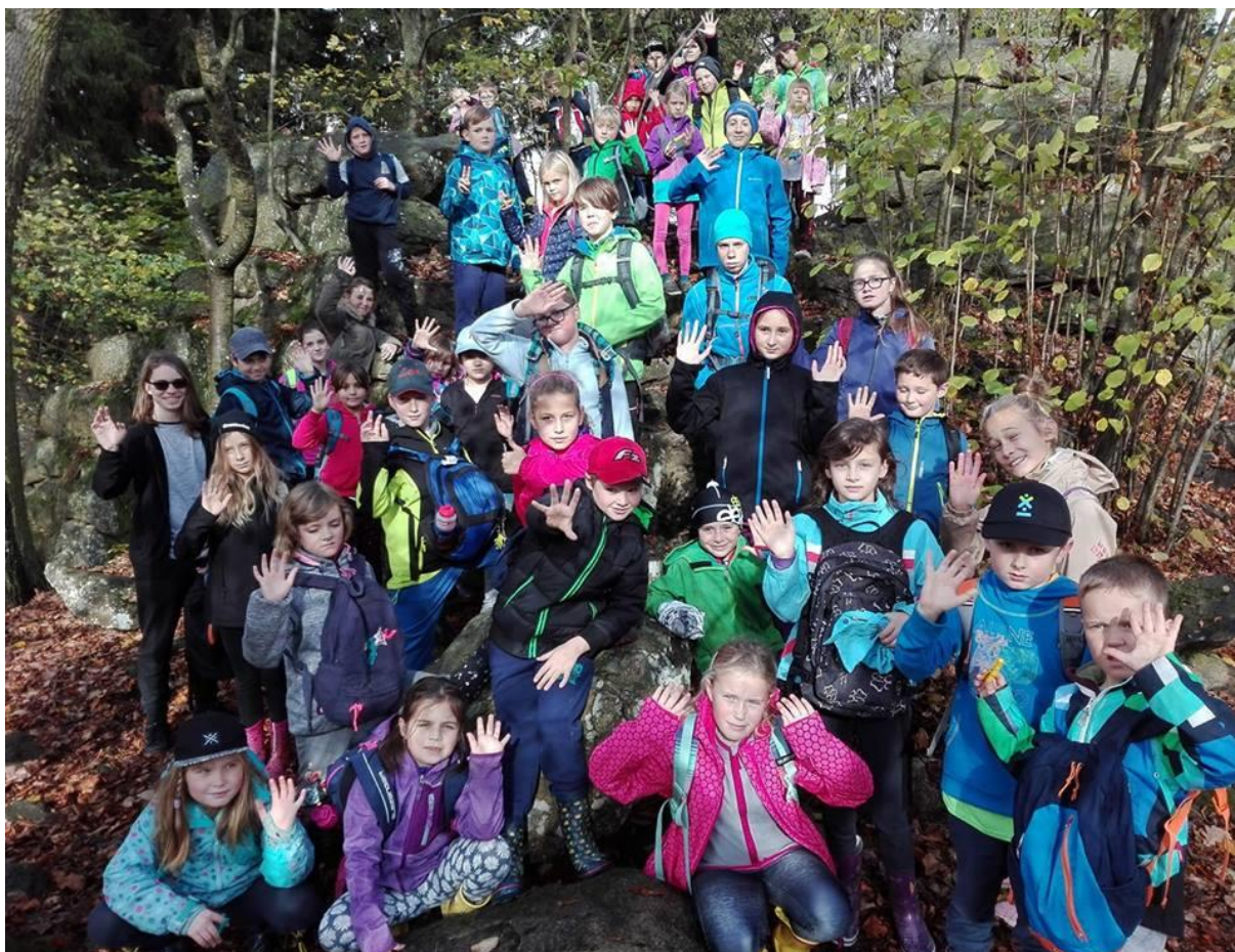
Obrázek 7 - Podzimní prázdniny, areál Kroužky nad Moníncem

Námi organizovaný pobyt v těchto dnech, kdy jsou školní prázdniny, ale rodiče jsou zapojeni do pracovního procesu měl velkou odezvu. Kapacita, kterou pro zimní ubytování areál Kroužky nad Moníncem nabízí, byla velmi rychle naplněna.