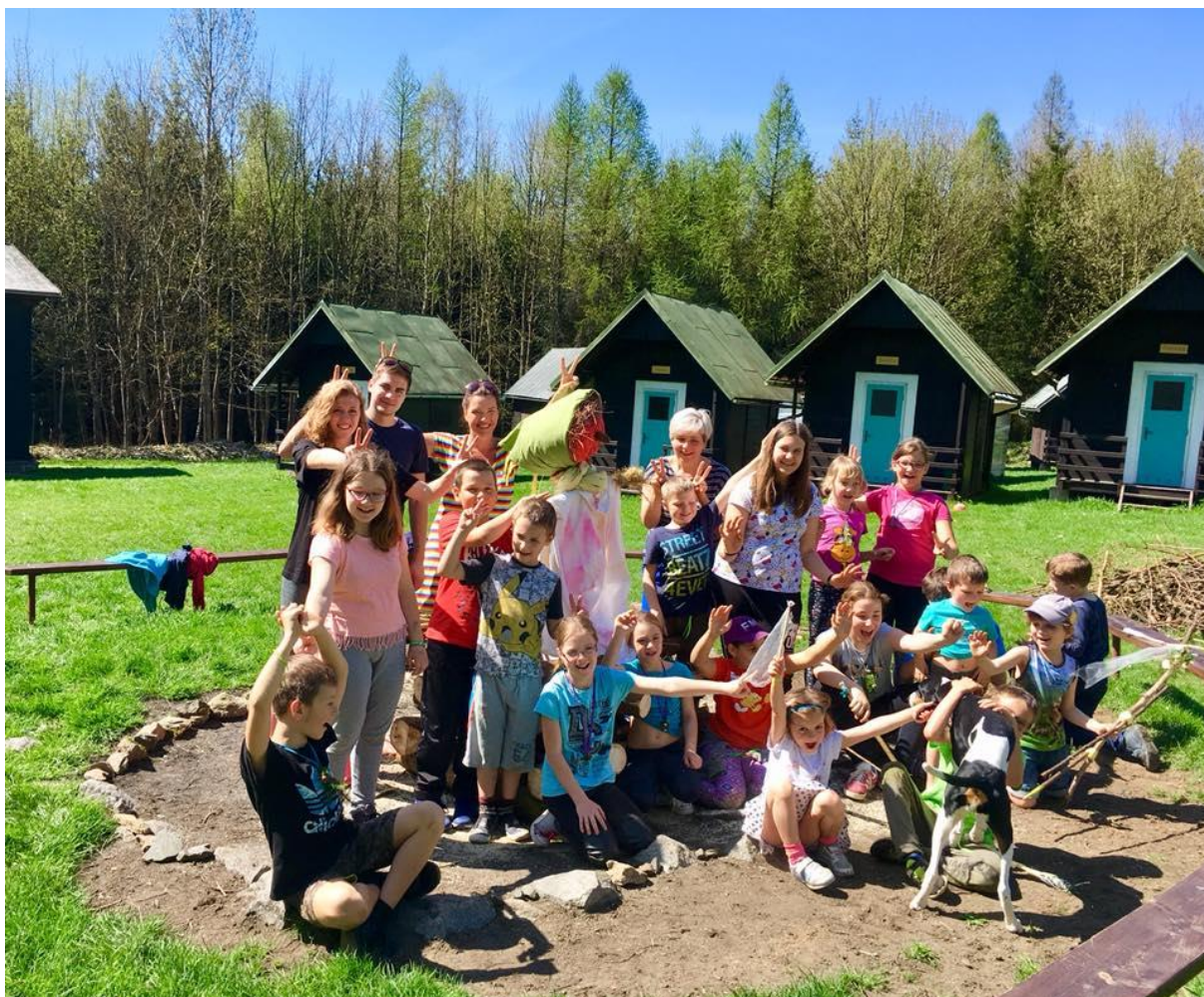
Obrázek 8 - Víkendová akce, Čáry, máry, fuk

Vzhledem k pozitivní odezvě ze strany a dětí i rodičů SVČ Kroužky bude v pořádání víkendových akcí pokračovat a plánuje nabídku ještě rozšířit.