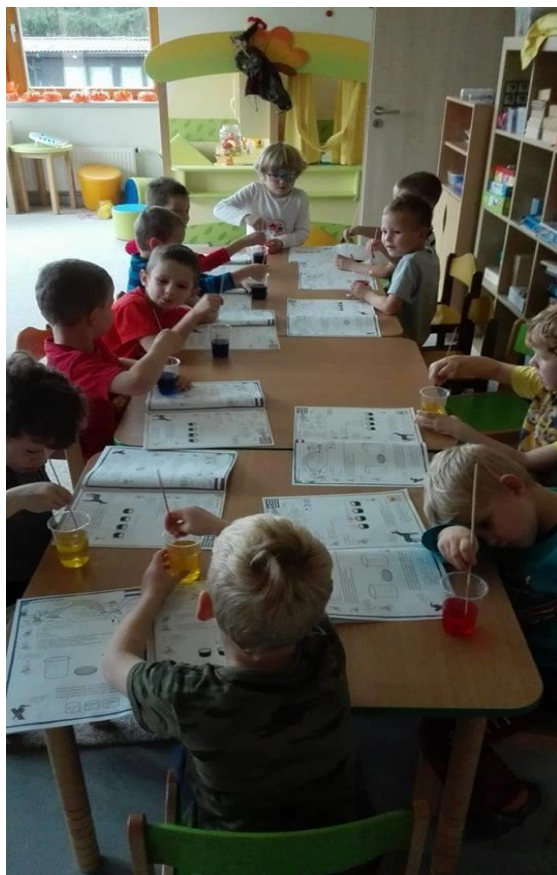
Obrázek 21 - Práce dětí s metodickým sešitem v naší partnerské škole