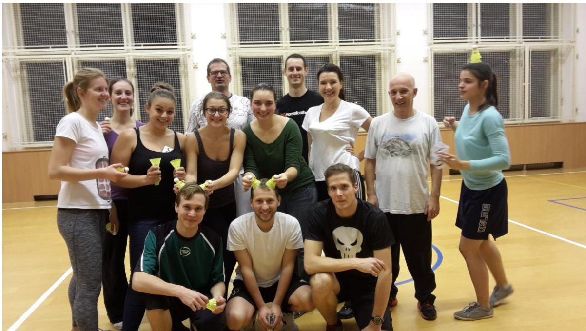
Obrázek 13 - Hry bez hranic - 9.12.2015

Podrobný popis akcí, jejich přínos a vyhodnocení je uveden v Příloze číslo 6 této zprávy