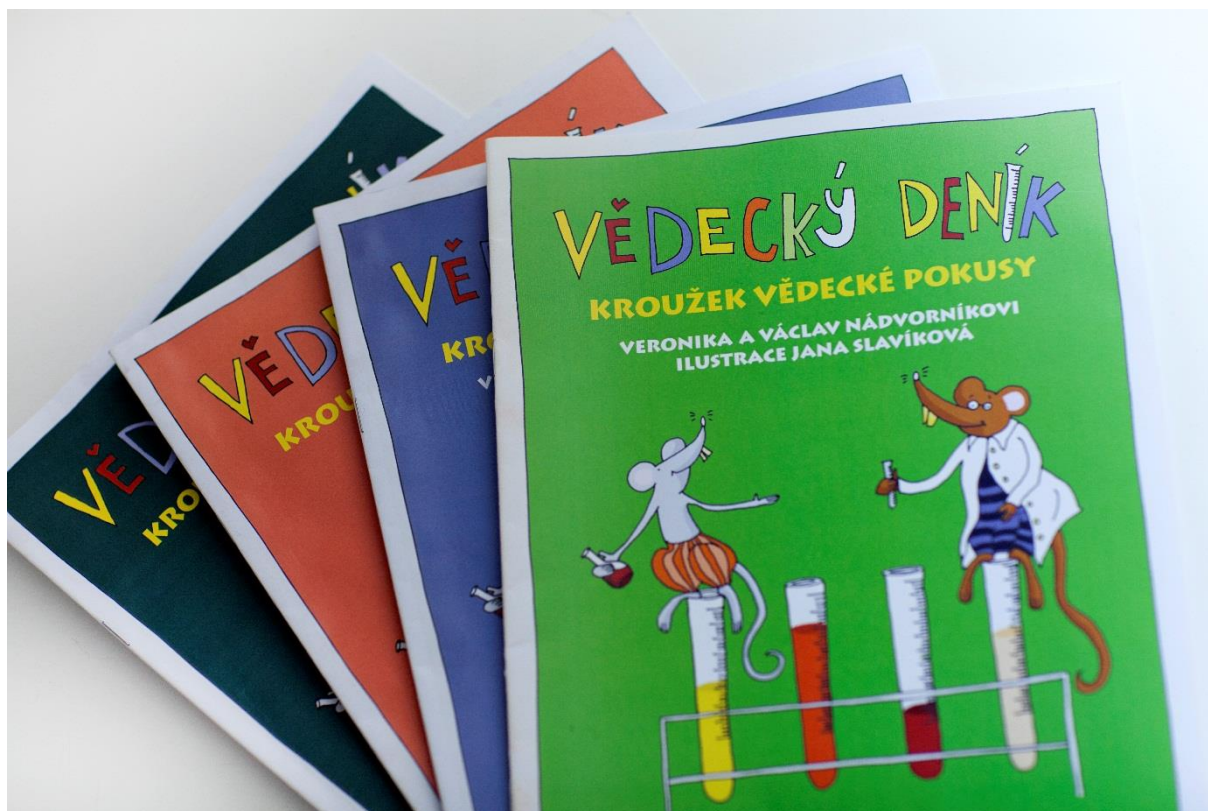
Obrázek 10 - Vědecké deníky na kroužek Vědecké pokusy