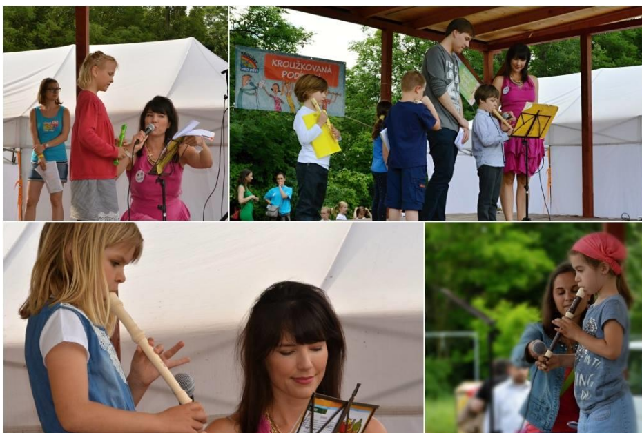
Obrázek 15 - Kroužkováná podivaná - 2.6.2016