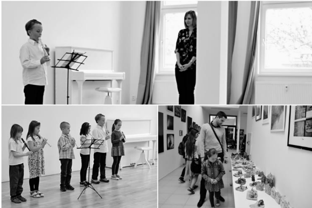
Obrázek 16 - Přehlídka keramických výrobků na téma MĚSTO - 12.5.2016