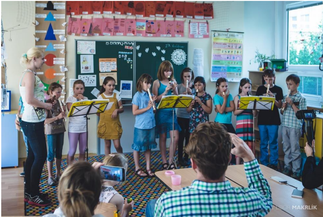
Obrázek 17 - Závěrečná ukázková lekce kroužku Hra na flétnu v ZŠ Angelovova