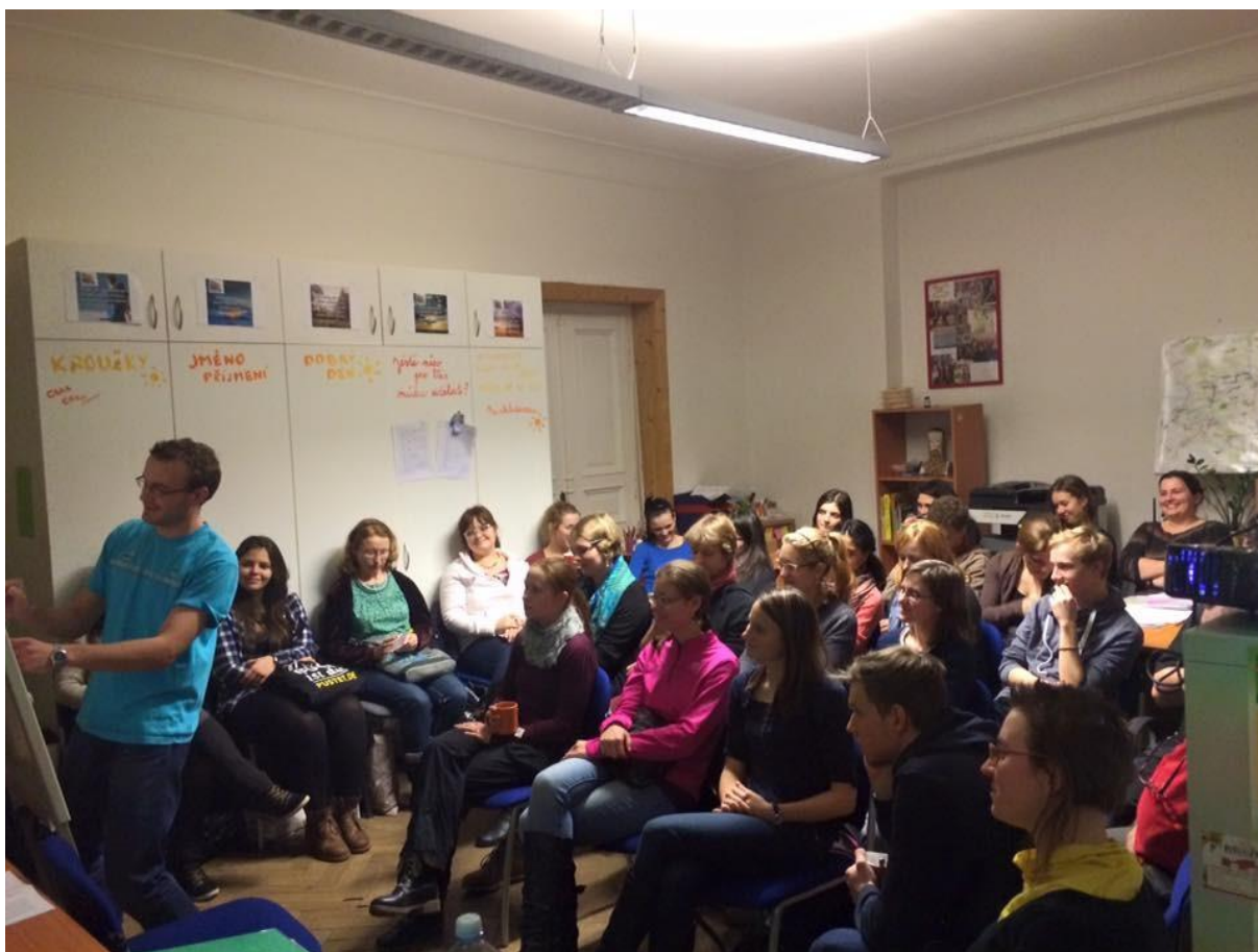
Obrázek 3 - Praktické rady a řešení situace „problémového dítěte“ na lekcí - 22.1.2016

V uplynulém školním roce zaměstnanci SVČ Kroužky pro děti absolvovali další vzdělávání nad rámec schváleného plánu DVPP. Nyní mají všichni interní zaměstnanci požadované vzdělání v souladu se zákonem č. 563/2004 Sb., o pedagogických pracovnících, v platném znění a podle ustanovení vyhlášky č. 317/2005 Sb., o dalším vzdělávání pedagogických pracovníků, akreditační komisi a kariérním systému pedagogických pracovníků, v platném znění. Interní zaměstnanci se zúčastnili kurzů či seminářů akreditovaných MŠMT i dalšího vzdělávání, které rozvíjelo jejich klíčové kompetence.