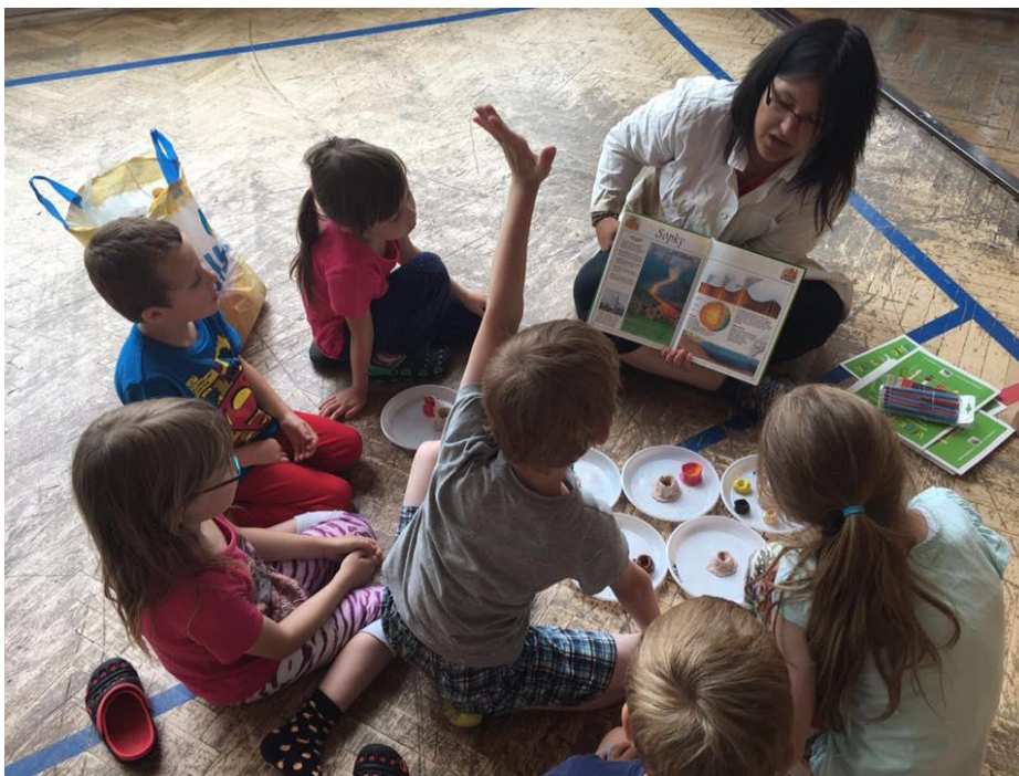
Obrázek 8 - Příměstský tábor