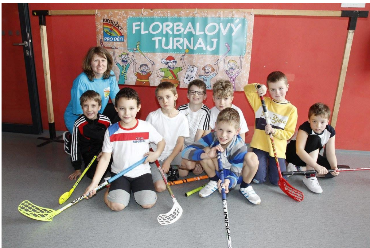
Obrázek 6 - Vánoční florbalový turnaj - 13.12.2015