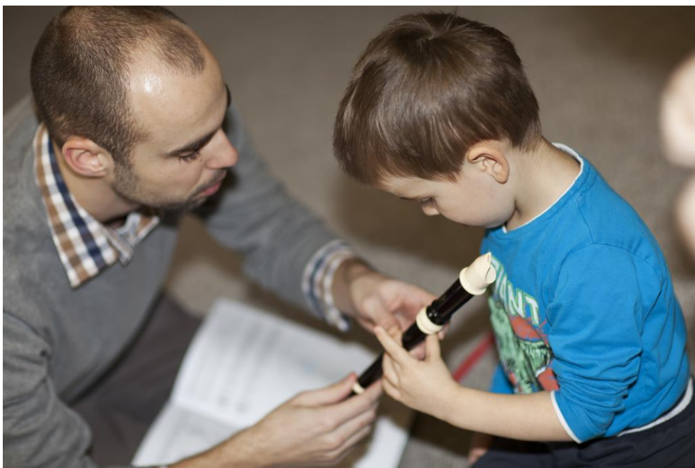
Obrázek 4 - Lekce kroužku Hra na flétnu v MŠ

Z výše uvedených důvodů počet účastníků zájmového vzdělávání v průběhu školního roku osciloval. K poslednímu červnu bylo evidováno 921 žáků a 22 dětí – účastníků zájmového vzdělávání.