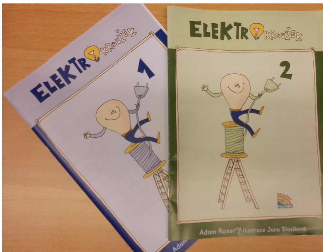
Obrázek 12 - Elektro deníky na kroužek Elektrohry