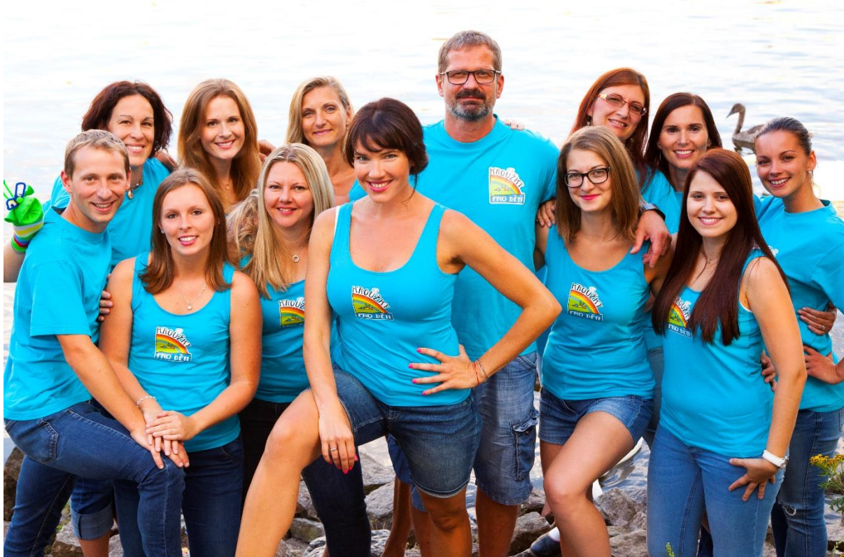
Obrázek 2 - Interní zaměstnanci

V SVČ Kroužky pro děti pracovalo v uplynulém školním roce na plný úvazek 0,5 interních pedagogických pracovníků, dalších 6 externích pedagogických pracovníků pracovalo sice na Dohodu o provedení práce, v podstatě však v režimu interních pracovníků. Pravidelná činnost byla soustředěna do 81 zájmových útvarů, kde mimo interní pracovníky pracovalo na Dohodu o provedení práce 99 externích pracovníků. Počet útvarů i externích zaměstnanců v průběhu školního roku kolísal dle zájmu účastníků zájmového vzdělávání.