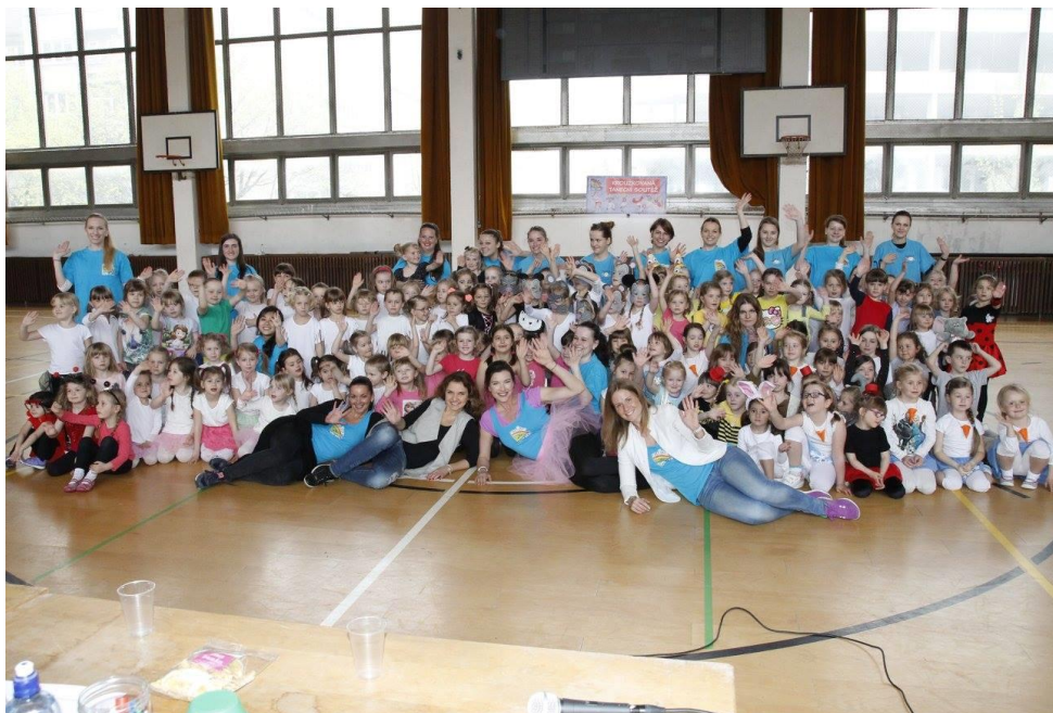
Obrázek 1 - Kroužková taneční soutěž - 9.4.2016

SVČ Kroužky pro děti je zejména tradičním organizátorem pravidelné zájmové činnosti. Nabídka zájmových útvarů byla ve školním roce 2015/2016 bohatá a pestrá, pedagogičtí pracovníci při nabídce vycházeli ze zájmů dětí, studentů a dospělých, z módního trendu a atraktivnosti.