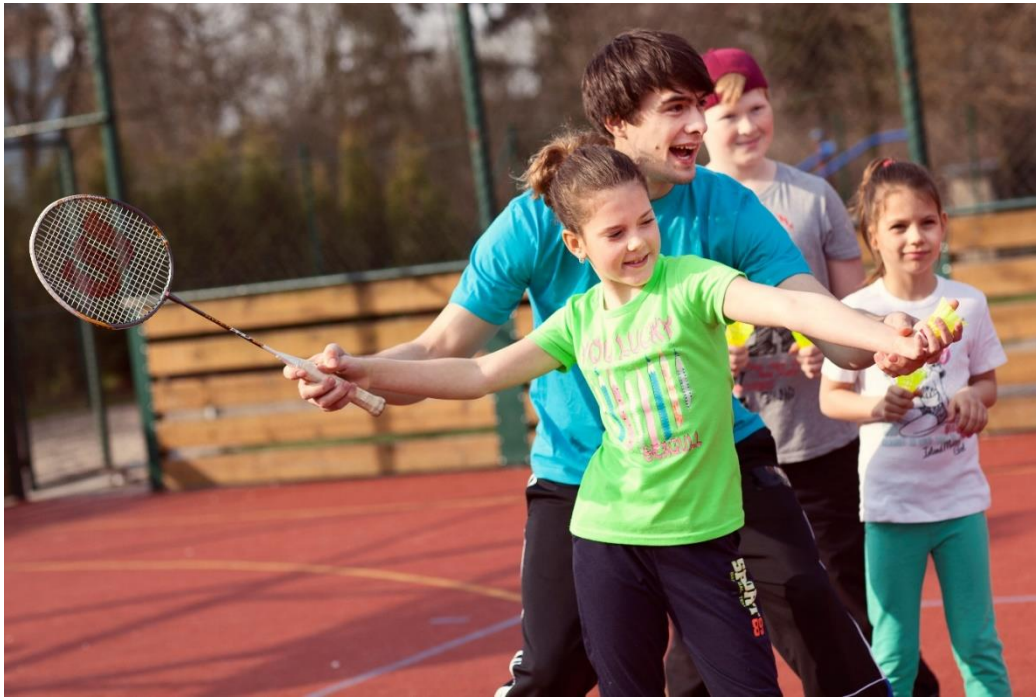
Obrázek 9 - Individuální práce s žákem