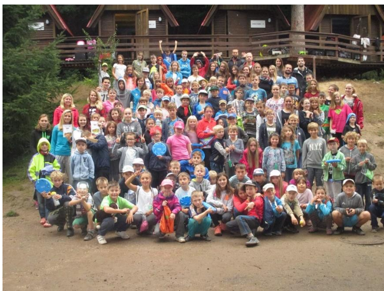
Obrázek 7 - Skupinová fotografie - Tábor Borek

SVČ Kroužky pro děti věnuje táborové činnosti velkou pozornost. Vycházíme z tradice zřizovatele a o letních prázdninách jsme v uplynulém školním roce pořádali pobytový tábor v Borku ve východních Čechách (dva týdenní turnusy). Účastnili se ho především žáci, kteří pravidelně navštěvují zájmovou činnost v našem SVČ Kroužky pro děti a žáci, kteří navštěvují zájmovou činnost v našich partnerských SVČ a nebo partnerských neziskových organizací, které se také zabývají zájmovým vzděláváním. SVČ Kroužky pro děti s pomocí zřizovatele v loňském školním roce zorganizoval příměstský tábor (2 týdenní turnusy).